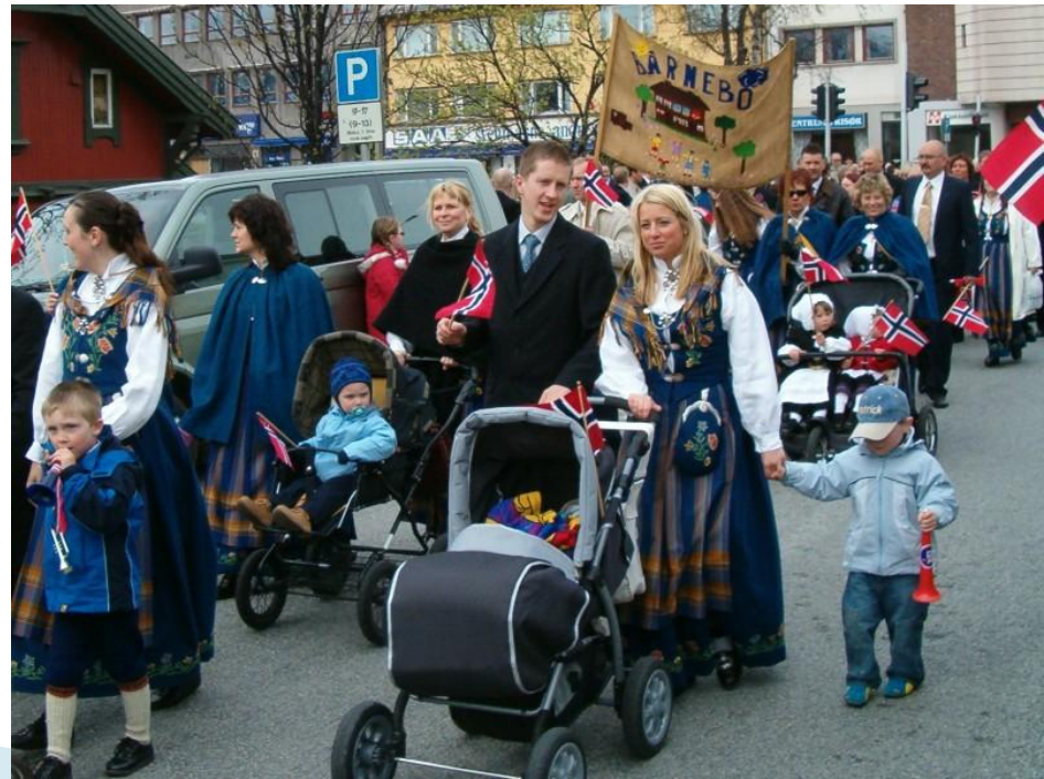
Празднование Дня Конституции Норвегии