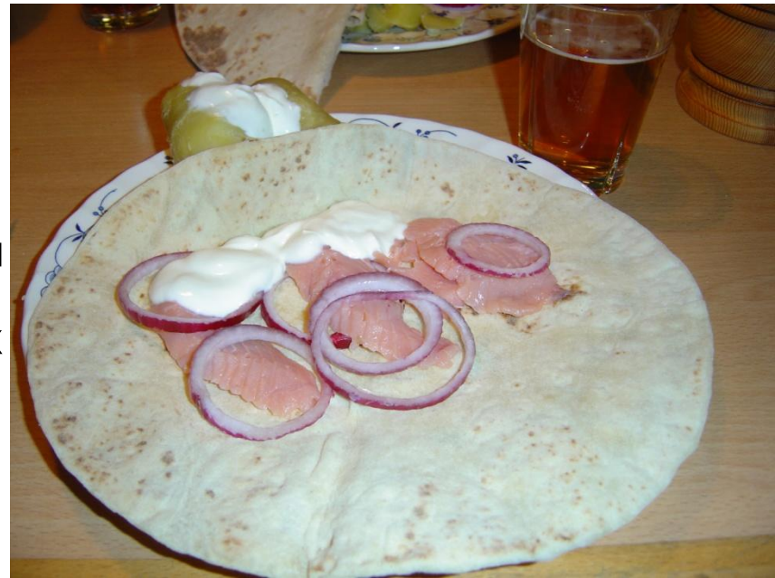
Лефсе с раkfиском