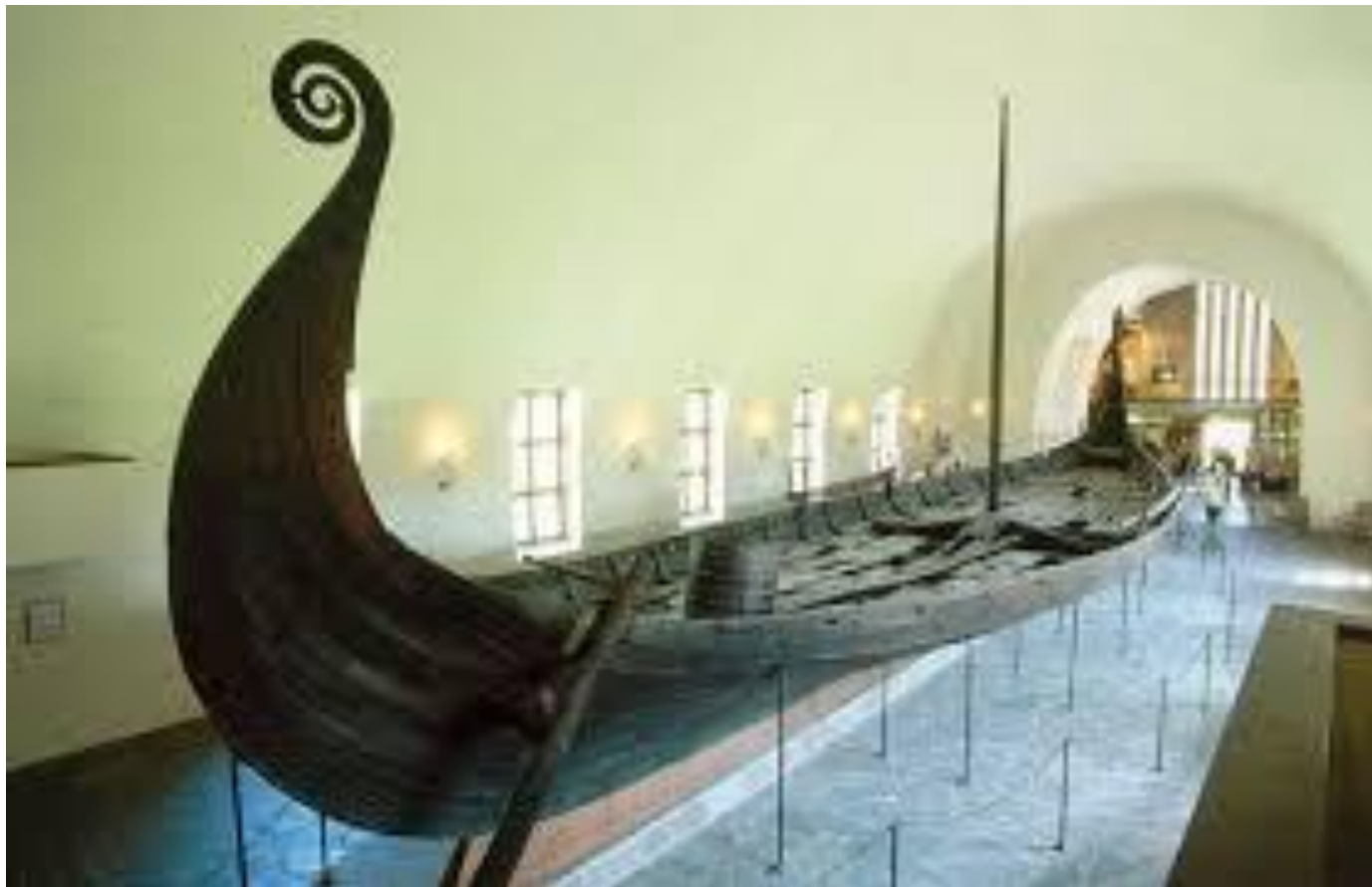
Музей кораблей викингов