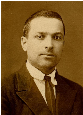
Рубинштейн Сергей Леонидович (1889-1960)