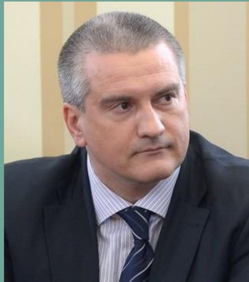
Аксенов Сергей Валерьевич

□ Исполнительную власть в Республике Крым осуществляют Глава Республики Крым, Совет министров Республики Крым и иные исполнительные органы государственной власти Республики Крым в соответствии с Конституцией и законами Республики Крым.