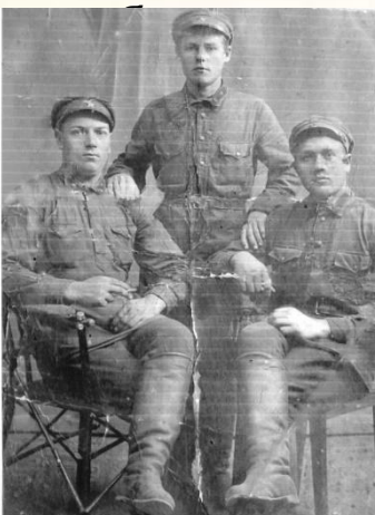
Мой прапрадедущка с товарищами