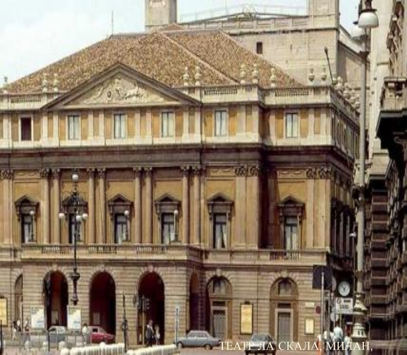
ТЕАТР ЛА СКАЛА, МИЛАН,