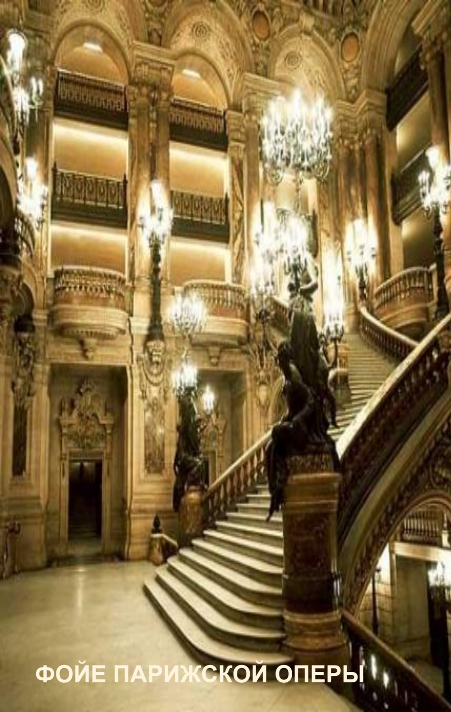
ФОЙЕ ПАРИЖСКОЙ ОПЕРЫ