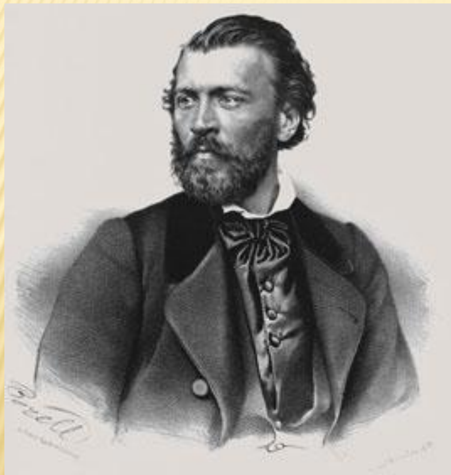
Яков Петрович Полонский (1819—1898)