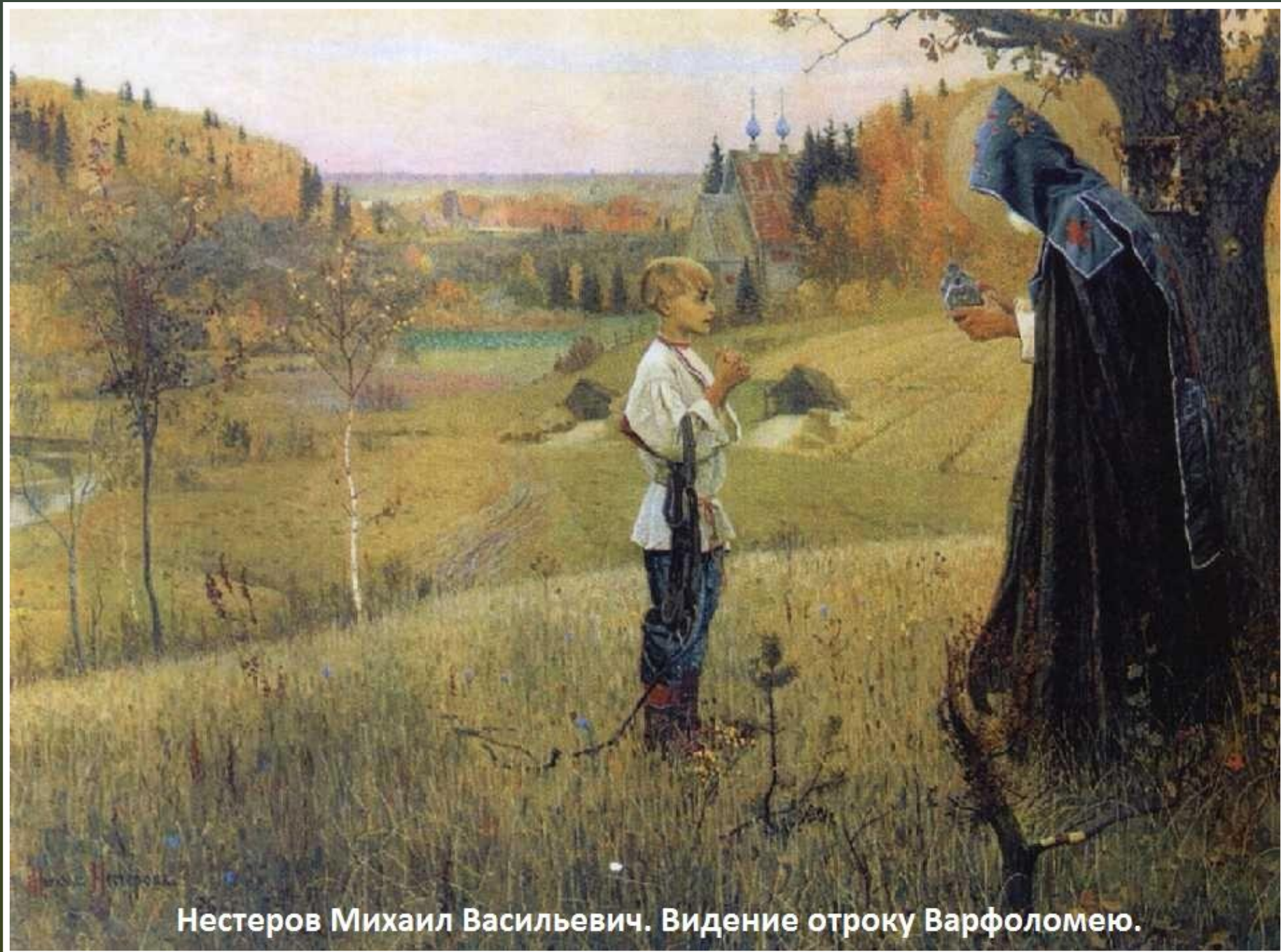
Нестеров Михаил Васильевич. Видение отроку Варфоломею.