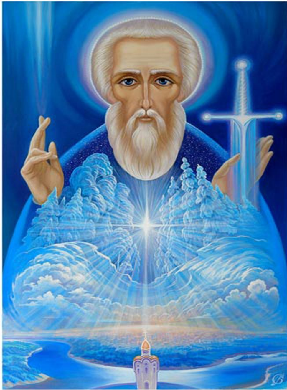
"Дар очищения" © Художник В. Суворов