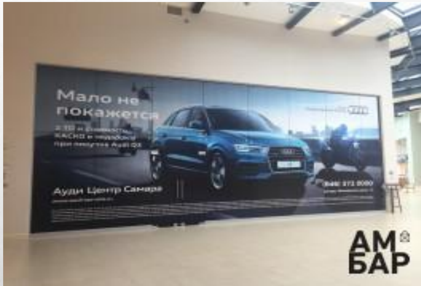
Реклама на витринах