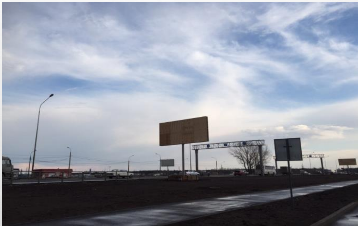
Реклама на щитах около ТК