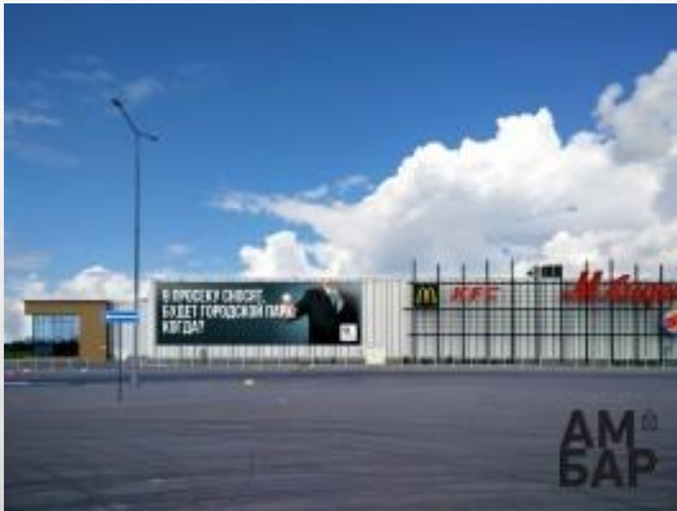
Реклама на фасаде