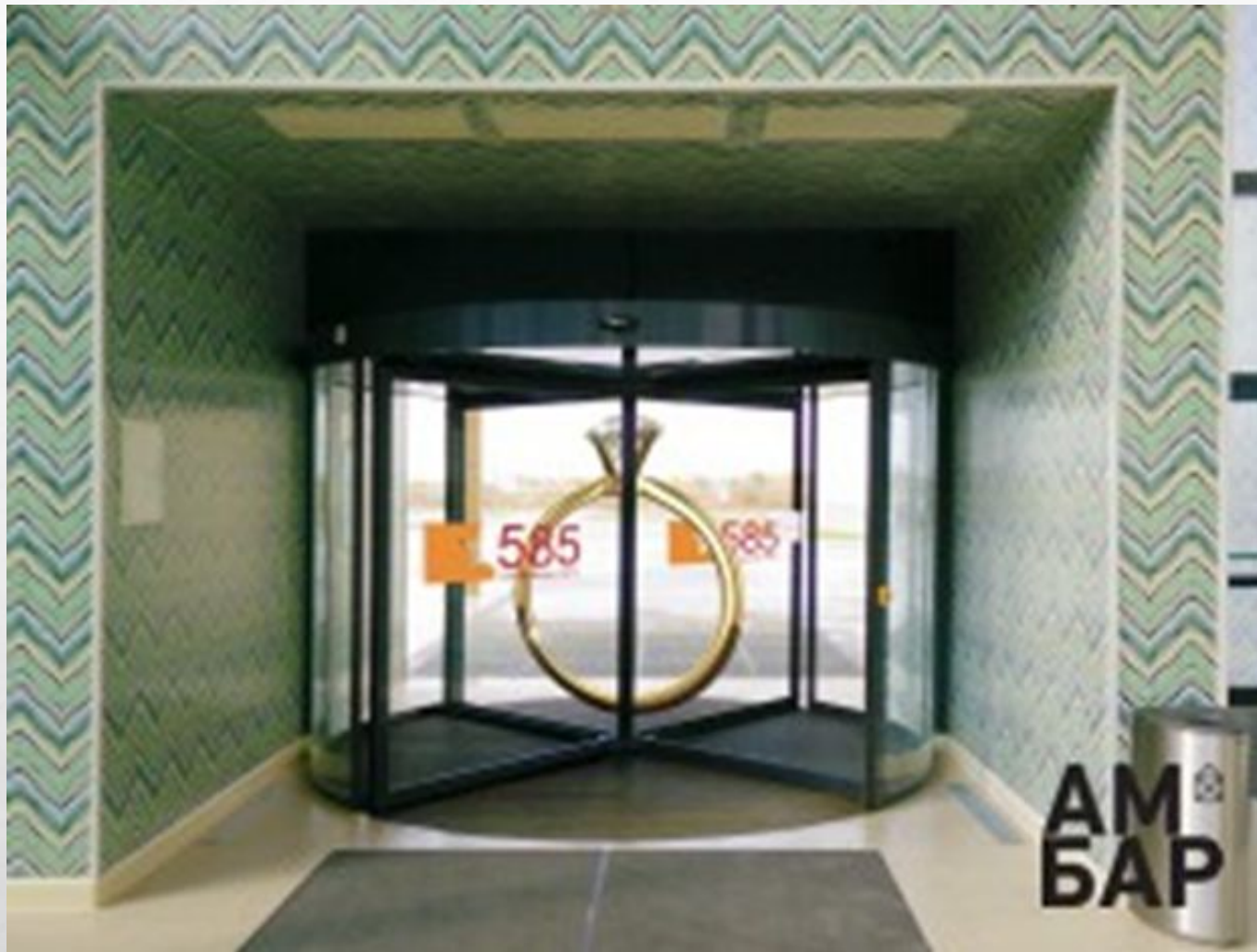
Брендинг входных групп