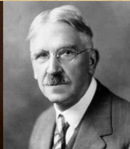
Дж. Дьюи (1859 - 1952)