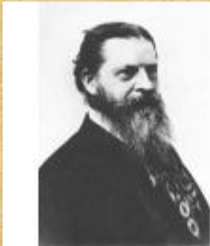
Ч. Пирс (1839 - 1914)