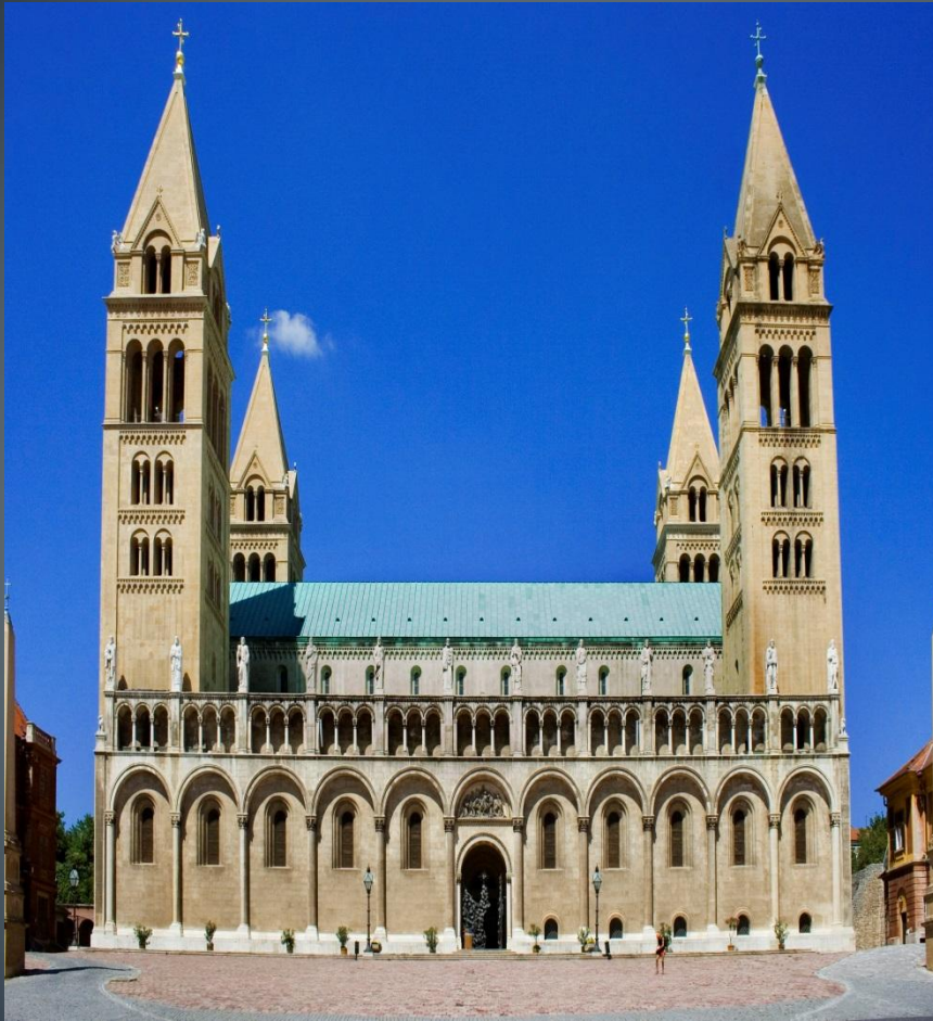
Кафедральний собор у Печі