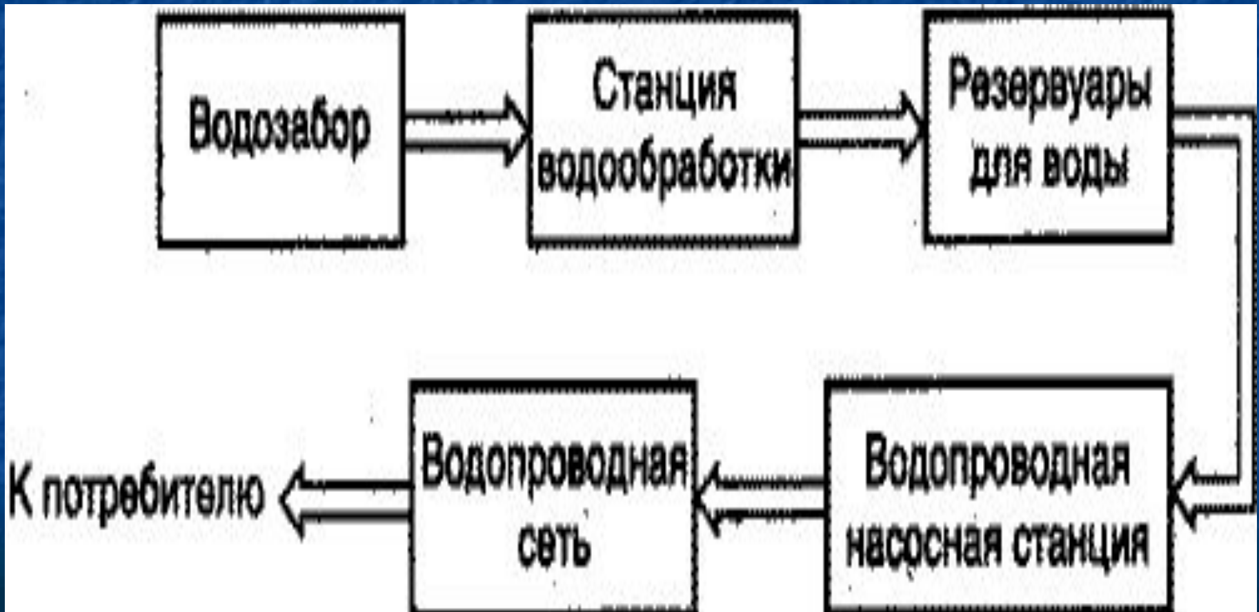
Схема централизованной системы водоснабжения