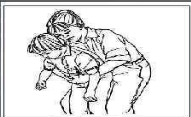
Рис. 8. Прием Хеймлиха