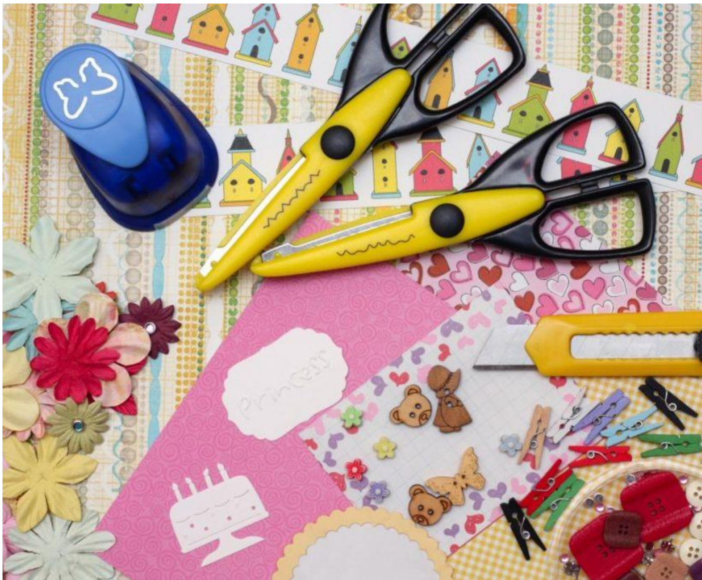
Материалы для работы по созданию скрапбукинга