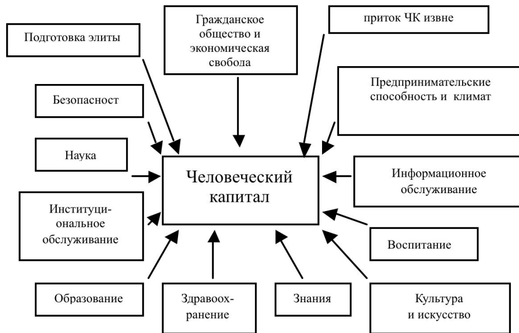
Рис. 1.2. Источники формирования национального человеческого капитала в широком определении