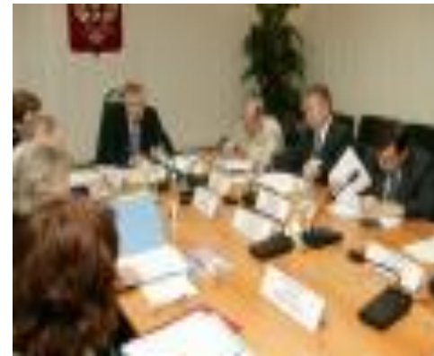
Официальная сфера, законодательство