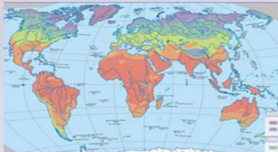
Агроклиматическая карта мира

Соотношение тепла и влаги, величина солнечной радиации и сезонность климатических изменений, влияющие на хозяйственную деятельность человека, называются агроклиматическими ресурсами . Географическое распределение этих ресурсов находит отражение на агроклиматической карте.