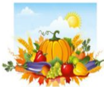
«Алтын күз» фестивалі