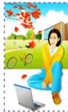
«Студенттік көктем» фестивалі