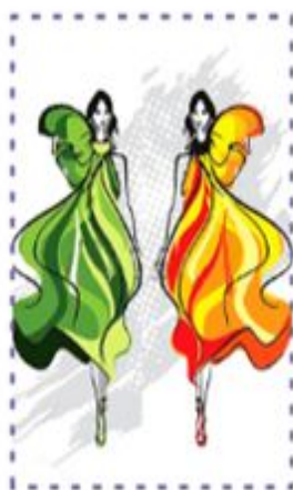
Shymkent Fashion Festival сән