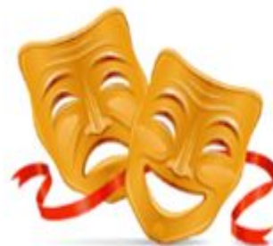
Ұлттық театр фестивалі