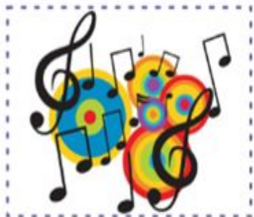
Шәмші Қалдаяқовтың «Менің Қазақстаным» ретро-фестивалі