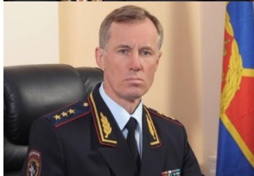
Горовой Александр Владимирович Первый заместитель Министра внутренних дел Российской Федерации генерал-полковник полиции