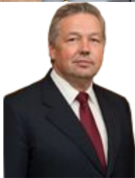
Савенков Александр Николаевич Заместитель Министра внутренних дел Российской Федерации – начальник Следственного департамента Министерства внутренних дел Российской Федерации действительный государственный советник Российской Федерации 1 класса