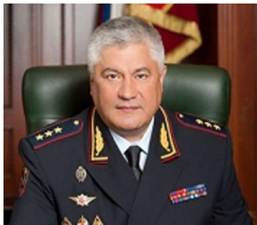
Колокольцев Владимир Александрович Министр внутренних дел Российской Федерации генерал полиции Российской Федерации