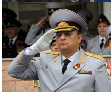
Зубов Игорь Николаевич Статс-секретарь - заместитель Министра внутренних дел Российской Федерации действительный государственный советник Российской Федерации 1 класса