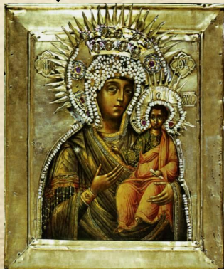
Икона «Богоматерь Смоленская». Тихон Филатьев. 1668 г. Икона из Новодевичьего монастыря в Москве.