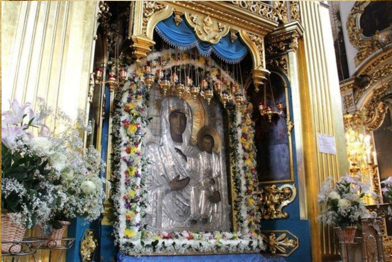
Икона Смоленской Божией Матери Одигитрии в Смоленске, Успенский собор