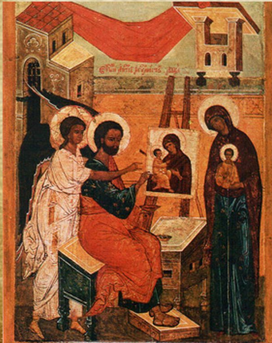
Создание иконы Божией Матери

Первообраз Иконы Божией Матери Одигитрии можно увидеть на выходной миниатюре греко-латинского Псалтыря. Там Матерь божия изображена в полный рост.