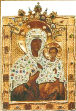
Список со Смоленской иконы Божией Матери. Благовещенский собор Кремля. Москва, 1456 год.