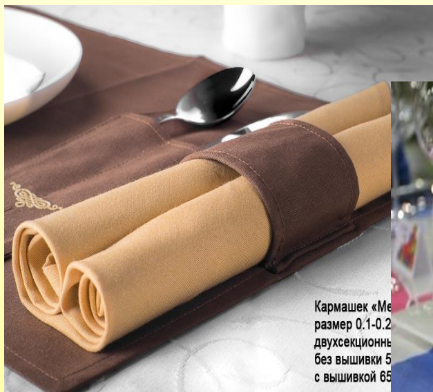
Кармашек «Ме размер 0.1-0.2 двухсекционн без вышивки 5 с вышивкой 65

Непременным атрибутом сервировки стола является салфетка . Без салфетки невозможно соблюсти чистоту за столом, более того, она исполняет не только функциональную роль, но и декоративную. Допускаются полотняные и бумажные салфетки, они выкладываются на тарелку или рядом с тарелкой.