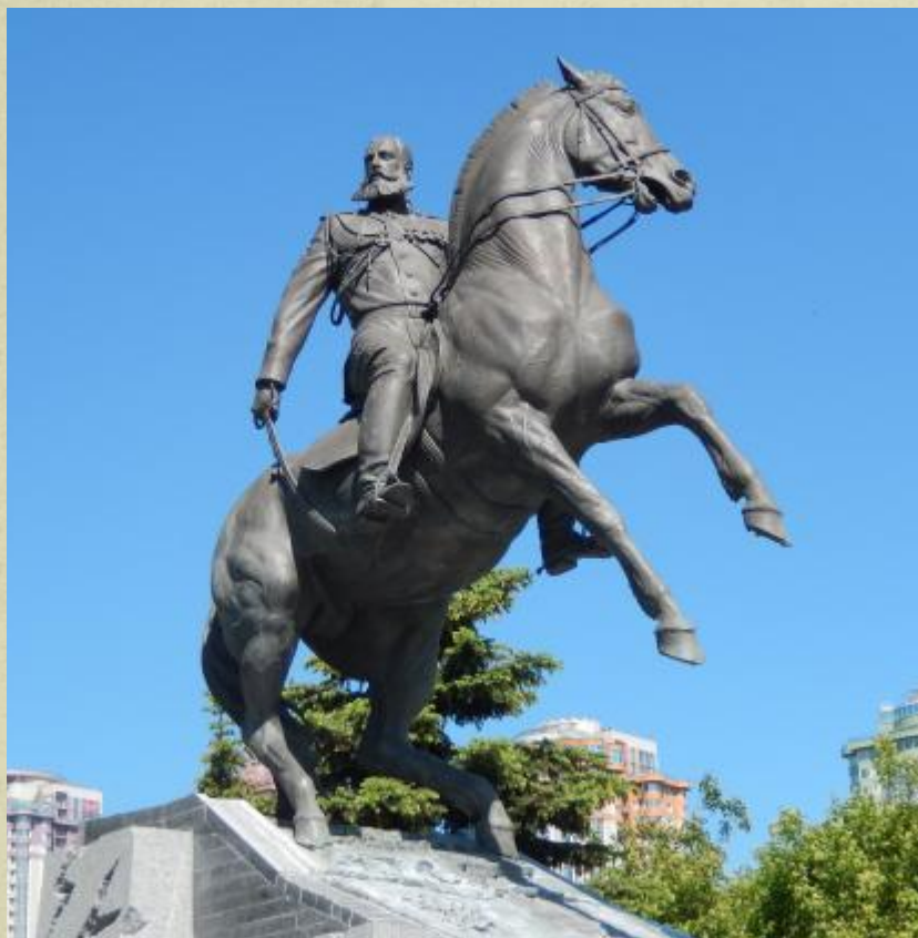
Современный памятник Скобелеву в Москве