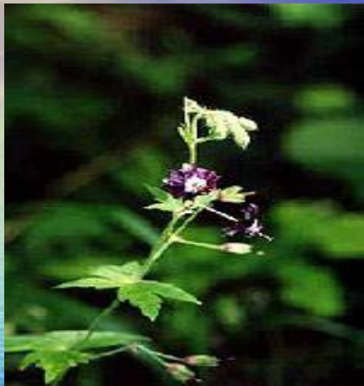
Герань темная (Красная книга)

Разнообразии почв и условий обусловило произрастание в Пуще 958 видов сосудистых споровых и семенных растений, что составляют 64% флоры Беларуси.