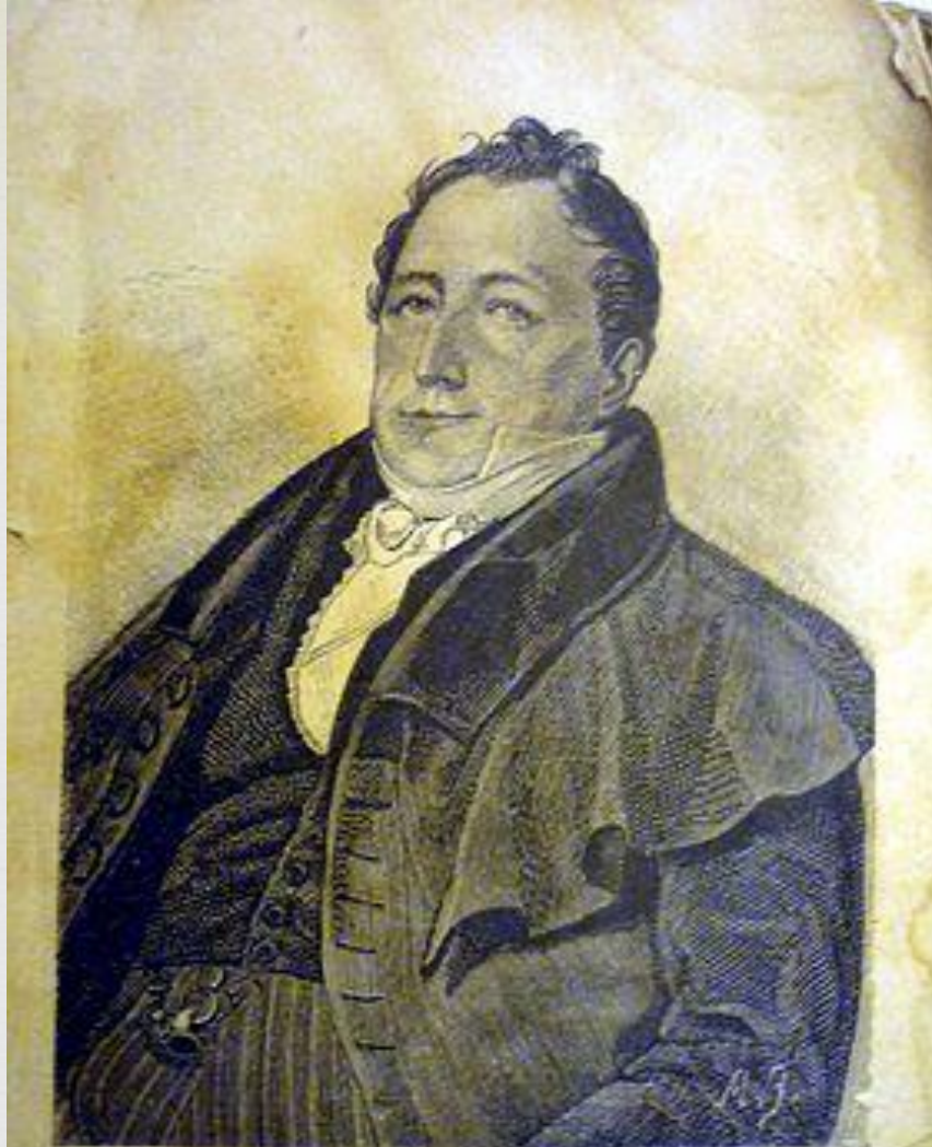
Сергей Львович Пушкинъ (отецъ поэта).