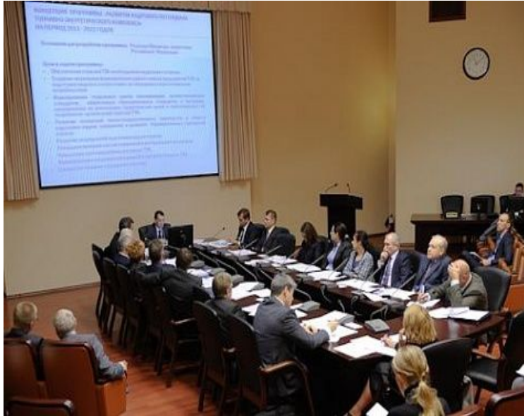
Заседание Совета Минэнерго России по вопросам кадрового потенциала ТЭК