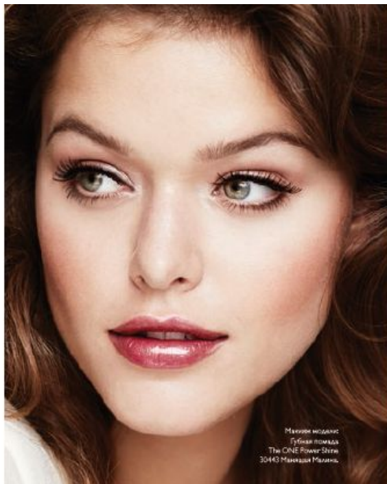
Модели моделики Губная помада The ONE Power Shine 30443 Макиажи Мадона.