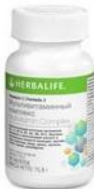
Формула — 2 Мультивитаминный комплекс