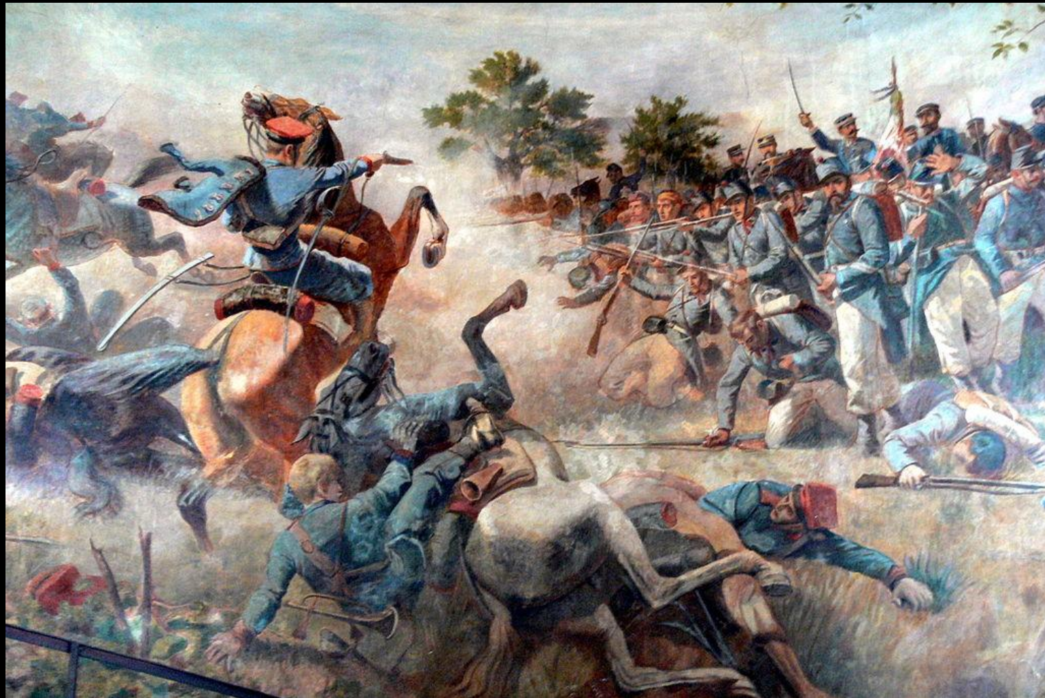
Битва при Кустоце