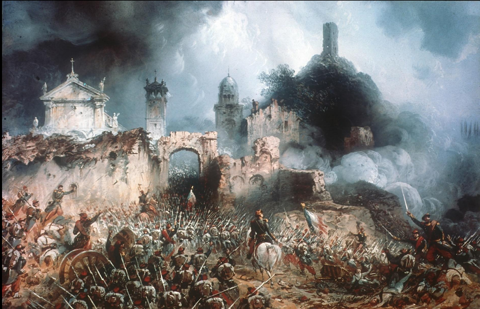
Битва при Сольферино