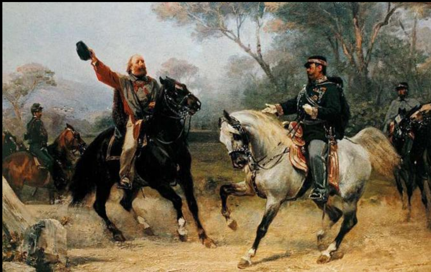
Встреча Гарибальди с Виктором Эммануилом II