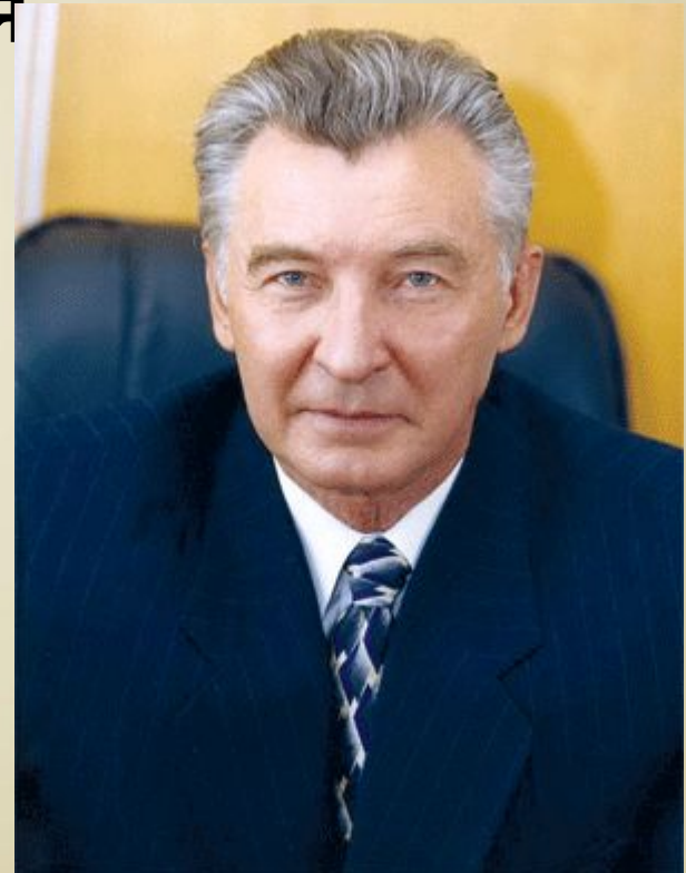
Притика Д. М.

Єдиної думки щодо найповнішої класифікації принципів не існує, це питання розробляється науковцями.