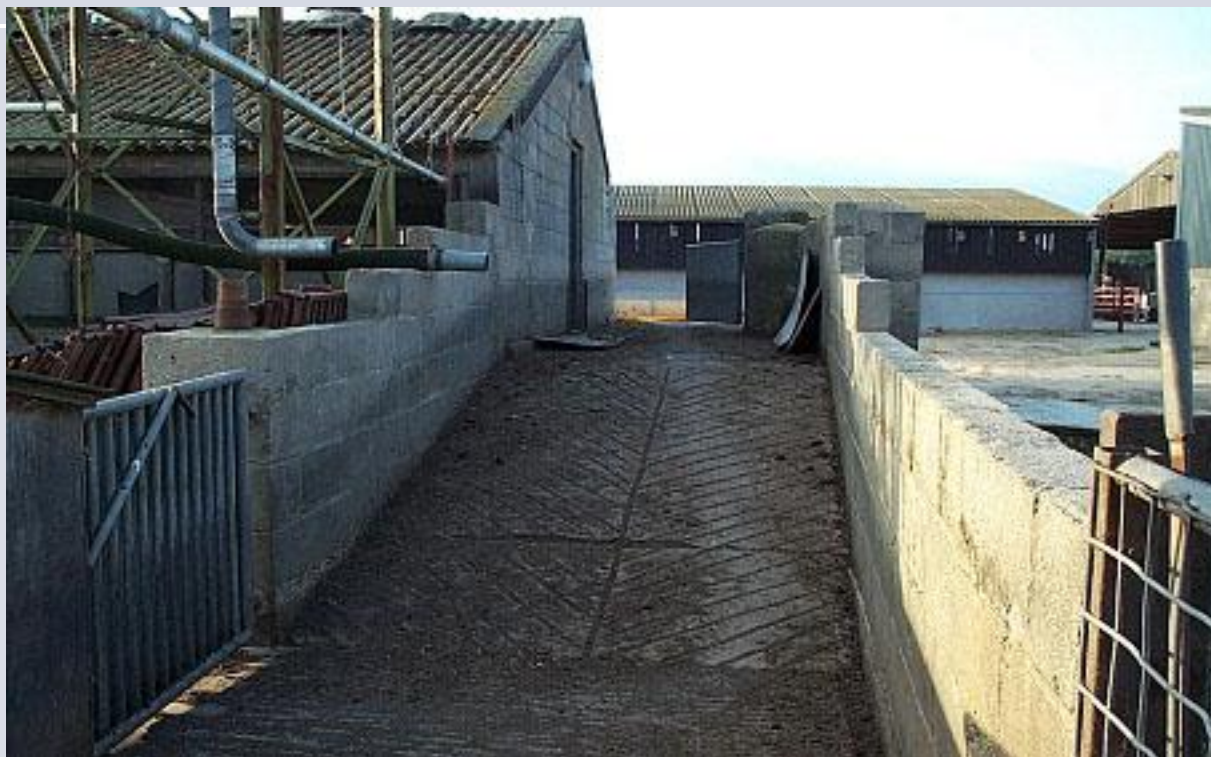
Погрузочные платформы для свиней