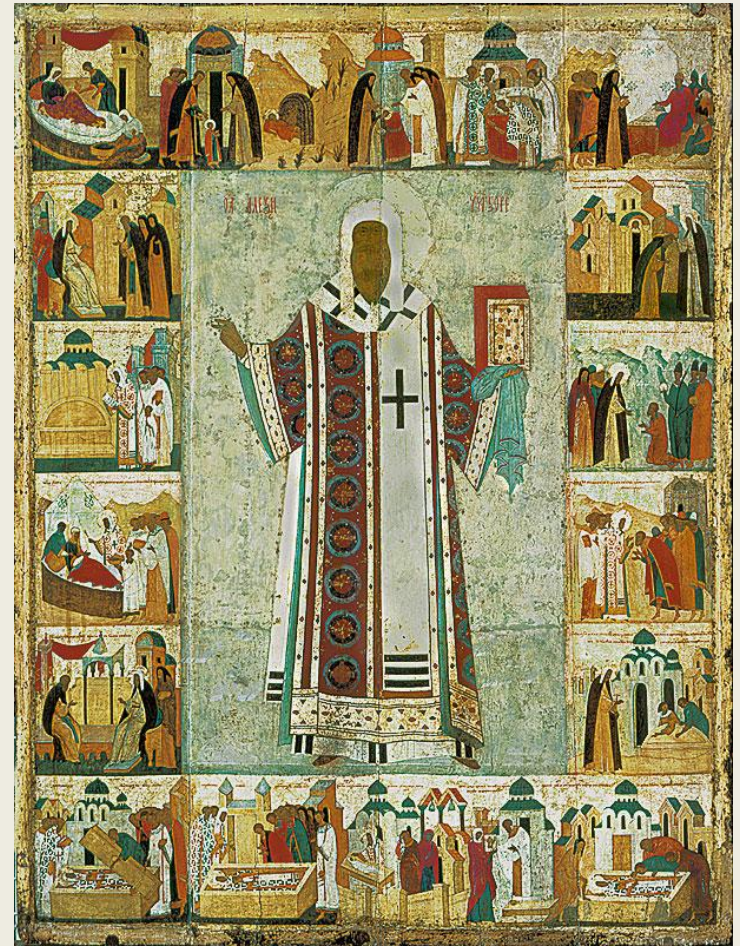
Святой митрополит Петр с житием