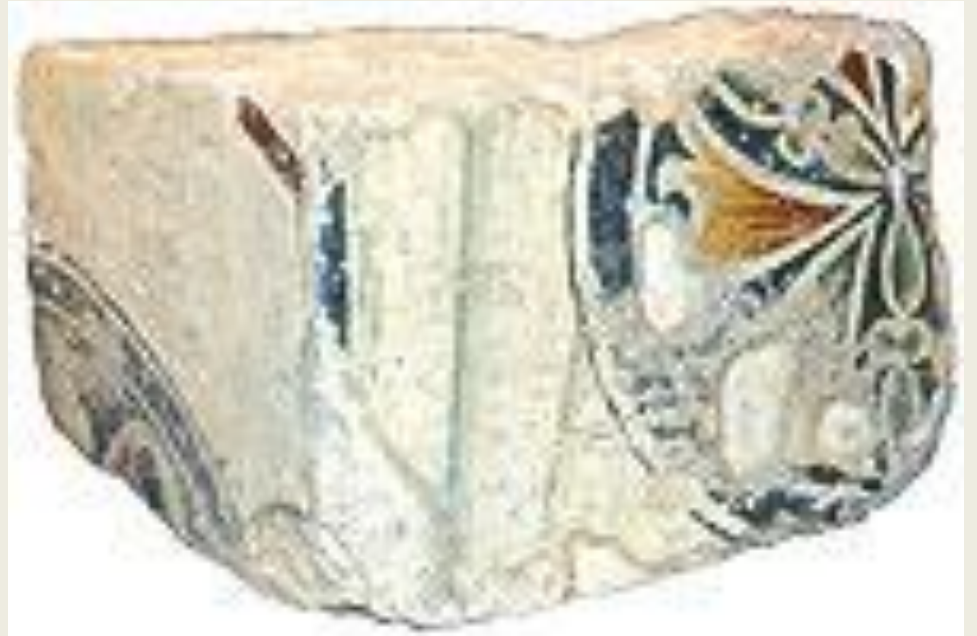
Медальон на пелене из цокольной части декорации.