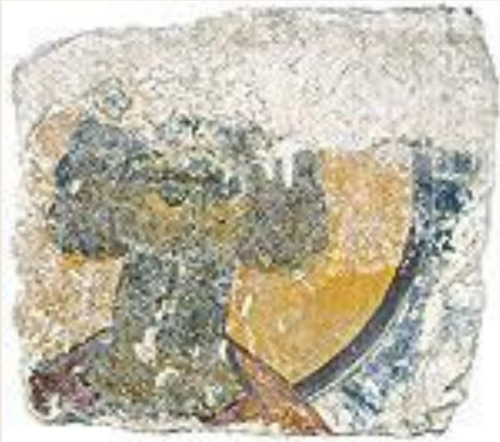
Голова неизвестного святого