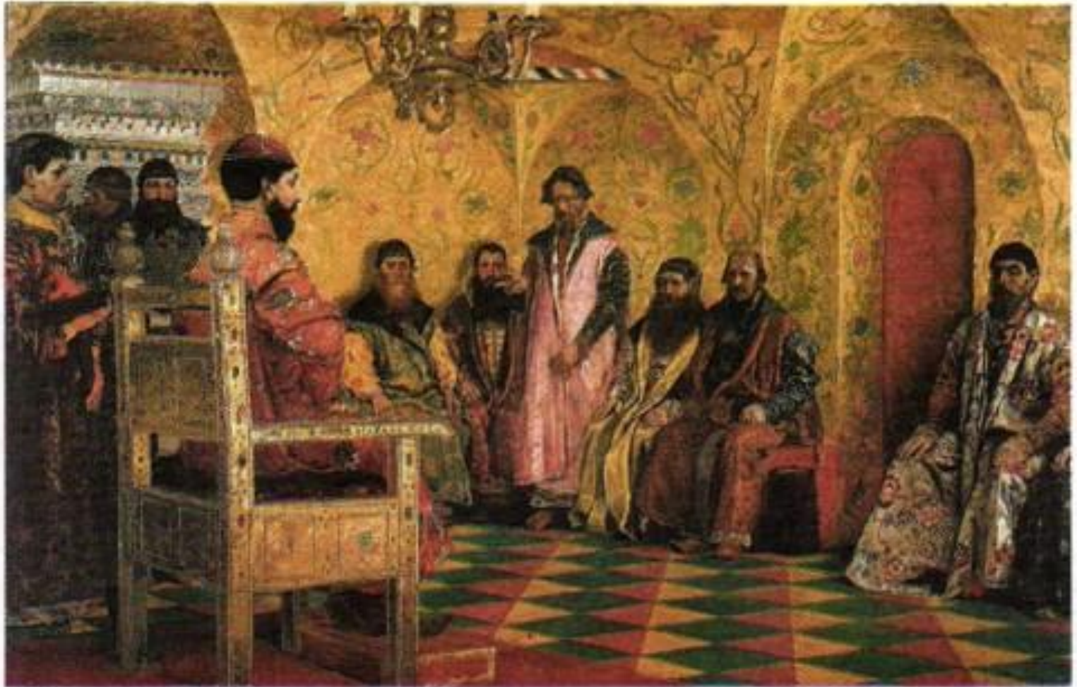
Боярская дума при Михаиле Романове. Художник А. Рябушкин.