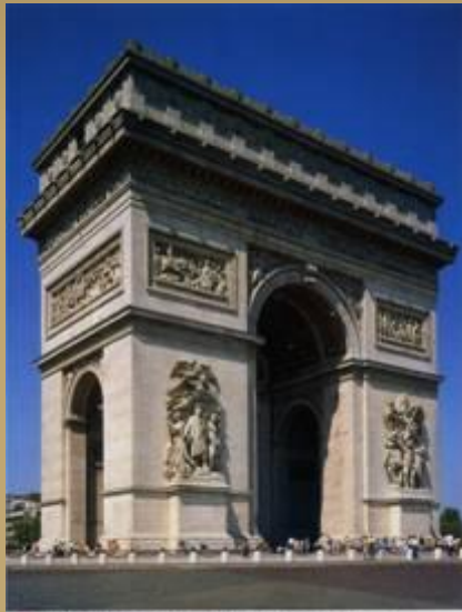
Voilà l'Arc de triomphe du côté des Champs-Élysées. Tu découvriras l'autre côté à la fin de l'article.

Основная цель архитектуры состоит в формировании среды для труда, быта и отдыха населения.