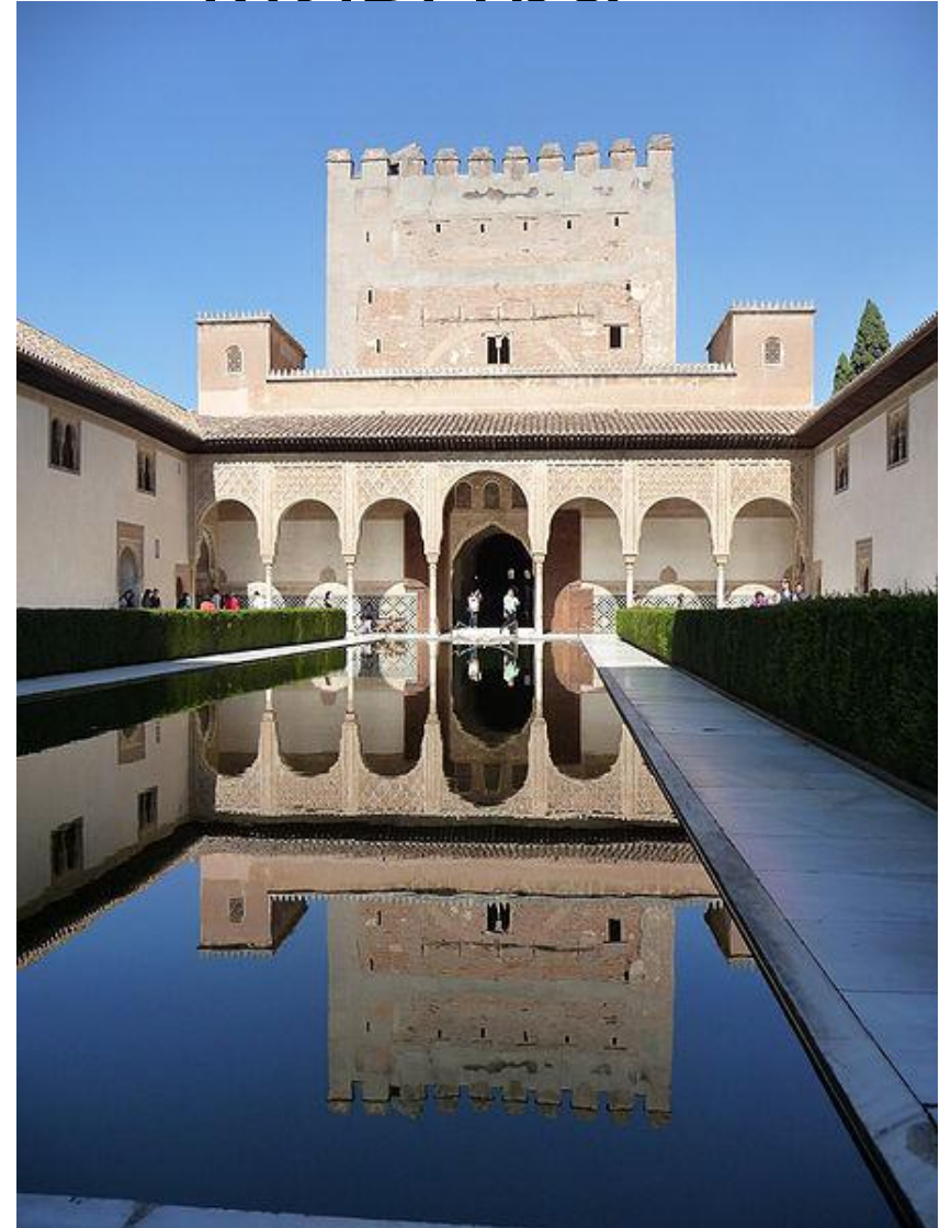
Хиральда (Севилья) и Альгамбра (Гранада)