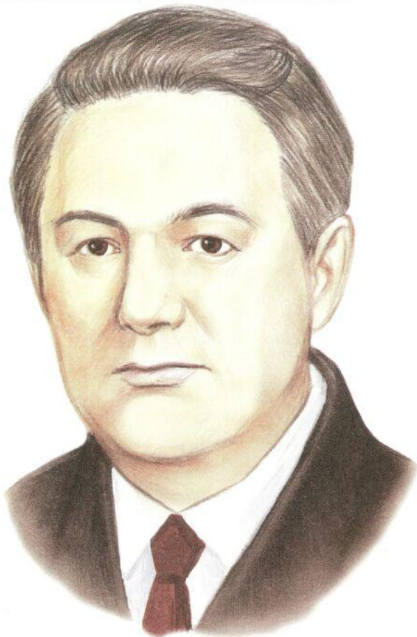
Сладков Николай Иванович (1920-1996)