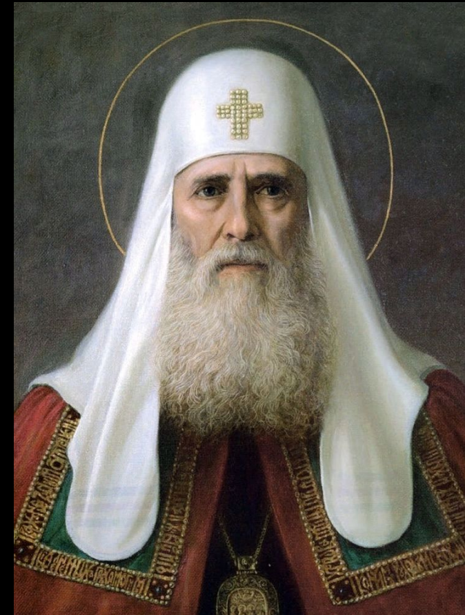
Первый патриарх всея Руси Иов

Присвоение русской церкви статуса патриархии, совершенное Вселенским патриархом Иеремией II в 1589 г. и подтвержденное Константинопольскими соборами 1590 г. и 1593 г.