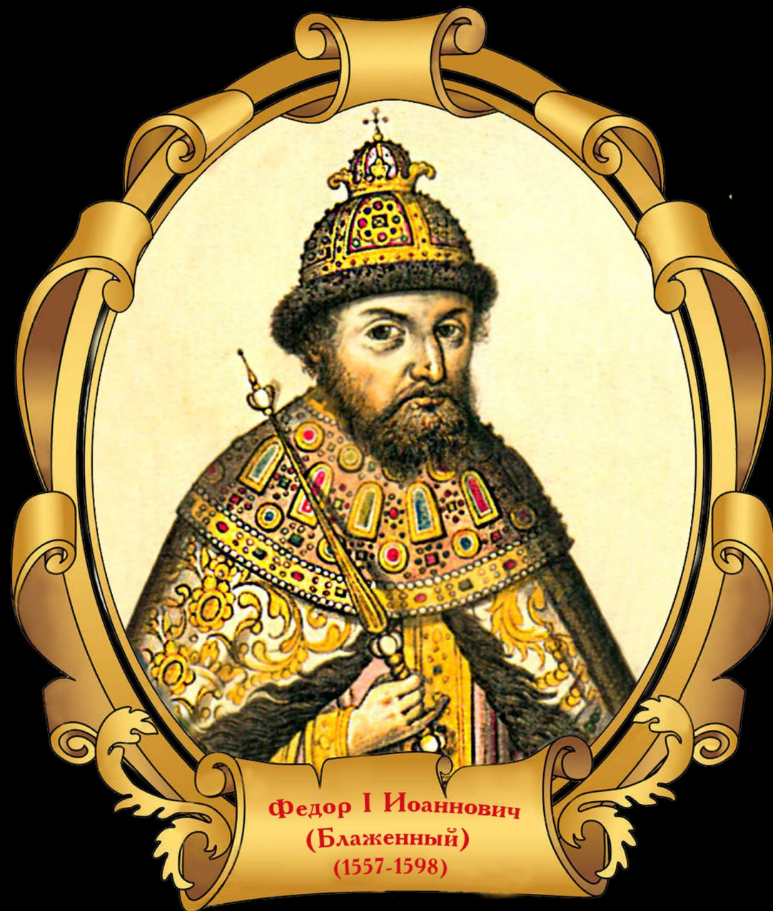
Федор I Иоаннович (Блаженный) (1557-1598)

Федор Иоаннович- царь всея Руси и великий Князь Московский с 18 марта 1584 года, третий сын Ивана IV Грозного и царицы Анастасии Романовны Захарьиной-Юрьевой, последний представитель московской ветви династии Рюриковичей.