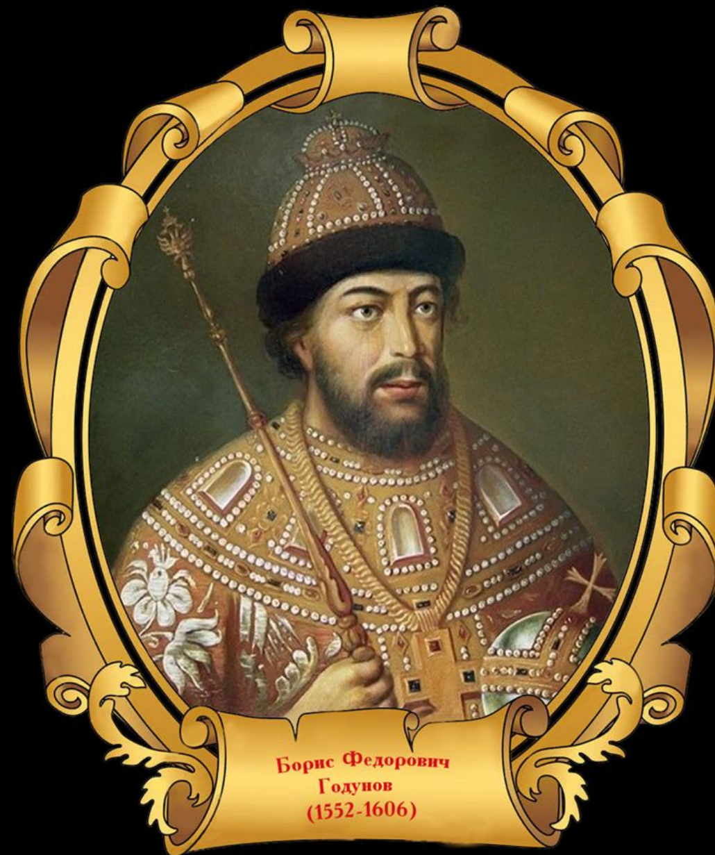
Борис Федорович Годунов (1552-1606)

Борис Федорович-боярин, шурина царя Фёдора I Иоанновича, в 1587-1598 фактический правитель государства, с 27 февраля 1598 года по 23 апреля 1605 года - русский царь.