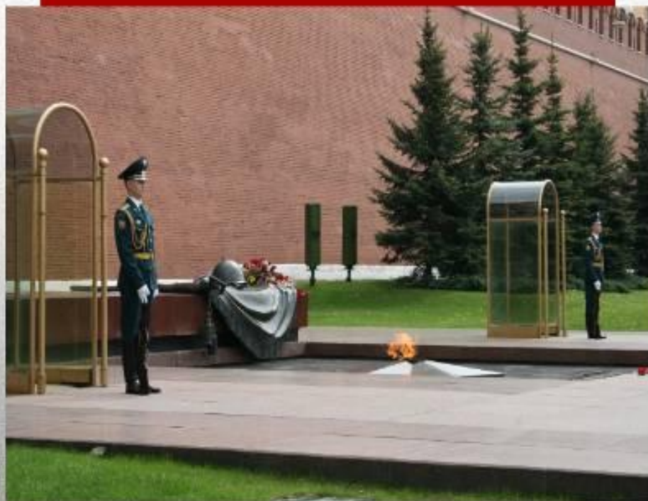
ПОСТ №1 Почётного караула у Памятника Неизвестному Солдату. г. Москва

В России всем от мала до велика известна могила Неизвестного солдата у красной стены Московского Кремля. Это одно из значимых мест нашей страны. К мемориалу во время всех государственных праздников торжественно возлагают цветы первые люди государства и высокие гости столицы, сюда стремятся многочисленные туристы и москвичи возложить цветы и посмотреть развод Почетного караула на Посту №1.