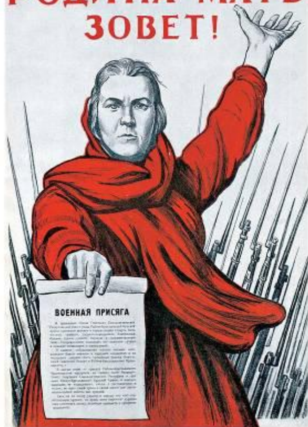
Плакат «Родина-мать зовет!» Художник И.М. Тоидзе, 1941 г.