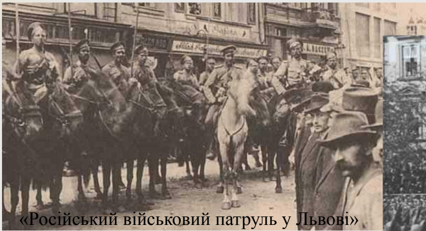
«Російський військовий патруль у Львові»