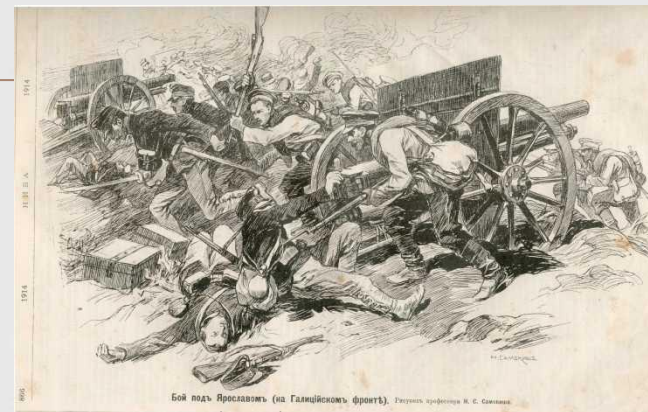
Бій під Ярославом, Галицький фронт» восени 1914 р.

Російські війська захопили Східну Галичину та Північну Буковину. Було створено генерал-губернаторство «Галицько-Буковинське», на чолі граф Бобринський.