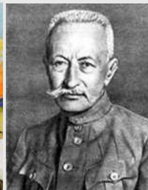
Генерал Олексій Брусилів (1853-1926)