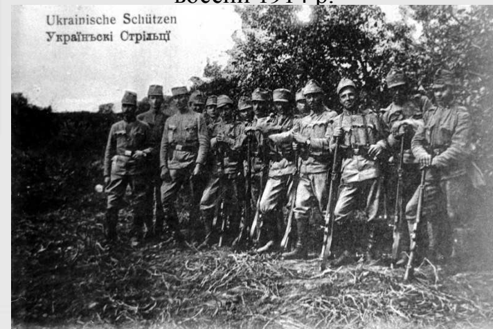
«Легіон Українських січових стрільців» 1914 р.