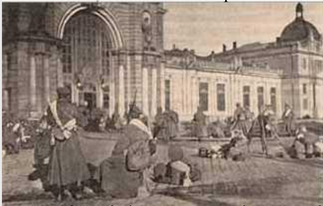
«Російські війська у Львові та Бучачі»