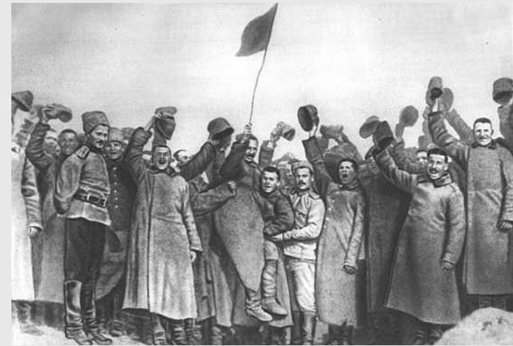
«Вихід Росії з війни»

Новий наступ російських військ (червень 1916 р.), поразка Росії, вона втратила Західні землі України, вийшла з війни.