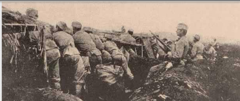
Січові стрільці в окопах під Галичем. 1915 р.