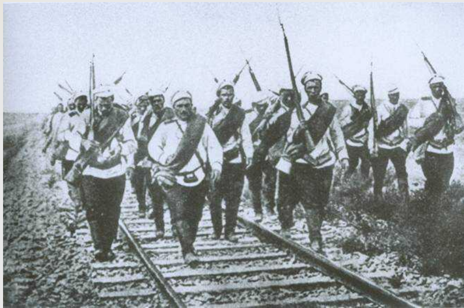
«Росіяни в Галичині» 1916 р.