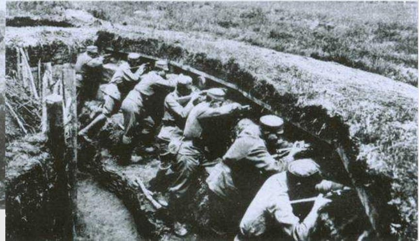
«У боях за Галичину» 1916 р.

Новий наступ російських військ (червень 1916 р.), поразка Росії, вона втратила Західні землі України, вийшла з війни.