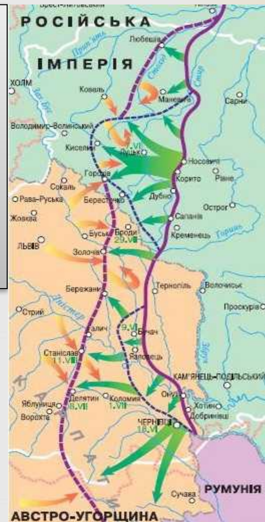
Україна в Першій світовій війні. Брусилівський прорив 4 червня – 13 серпня 1916 р.