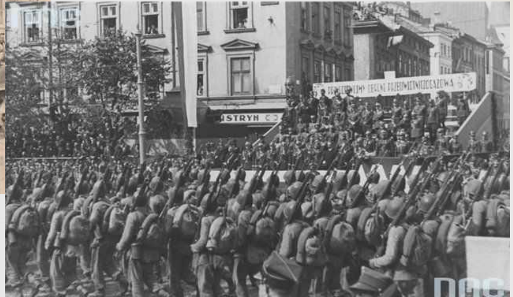
«Австро-німецькі війська окупували Львів» 1915 р.