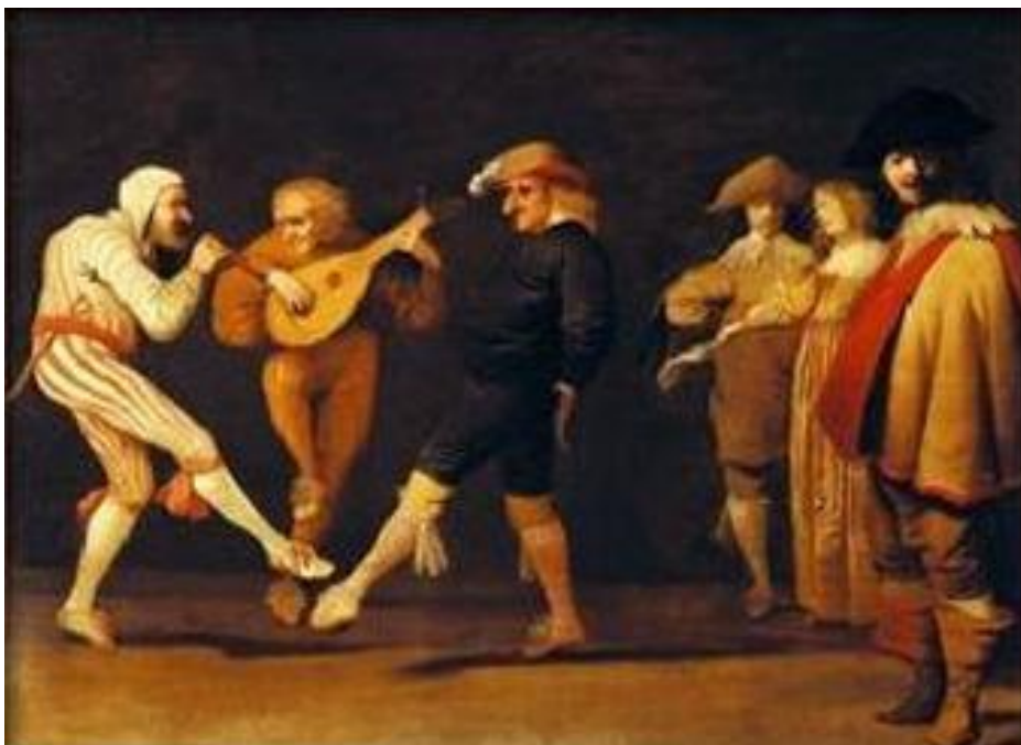
П. Каст. Пляшущие актеры средневекового фарса