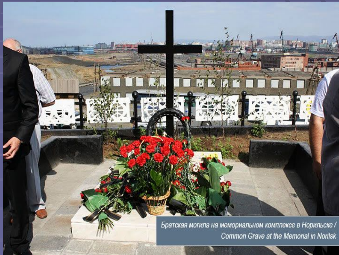
Братская могила на мемориальном комплексе в Норильске / Common Grave at the Memorial in Norilsk