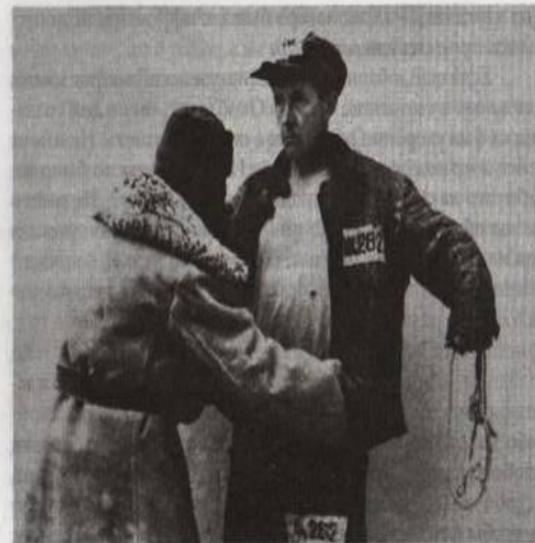
Обыск на проходе

Всё это вспомнив, пожалуй, не удивитесь, что ношение номеров было далеко не самым чувствительным или язвительным способом унижить достоинство арестанта. Когда Иван Денисович говорит, что «они не везят, номера», это вовсе не утеря чувства достоинства (как упрекали гордые критики, сами номера не носившие, да ведь и не голодавшие), — это просто здравый смысл. Досада, причиняемая нам номерами, была не психологическая, не моральная (как рассчитывали хозяева ГУЛАГа) — а практическая досада, что под страхом карцера надо было тратить досуг на пришивку отпорванного края, подновлять цифры у художников, а изодравшиеся при работе тряпки — целиком менять, изыскивать где-то новые лоскуты.