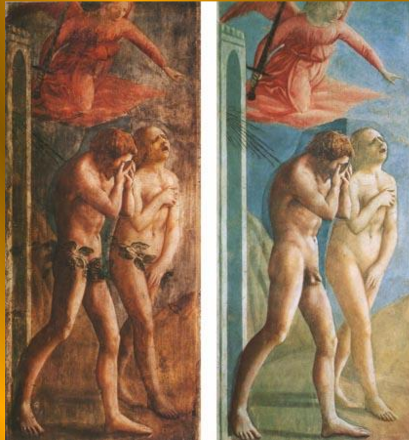
Изгнание из рая