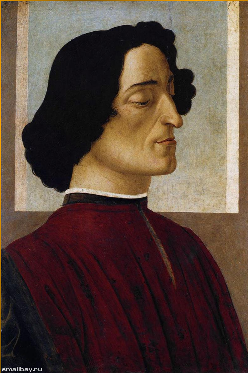
Портрет Джулиано Медичи