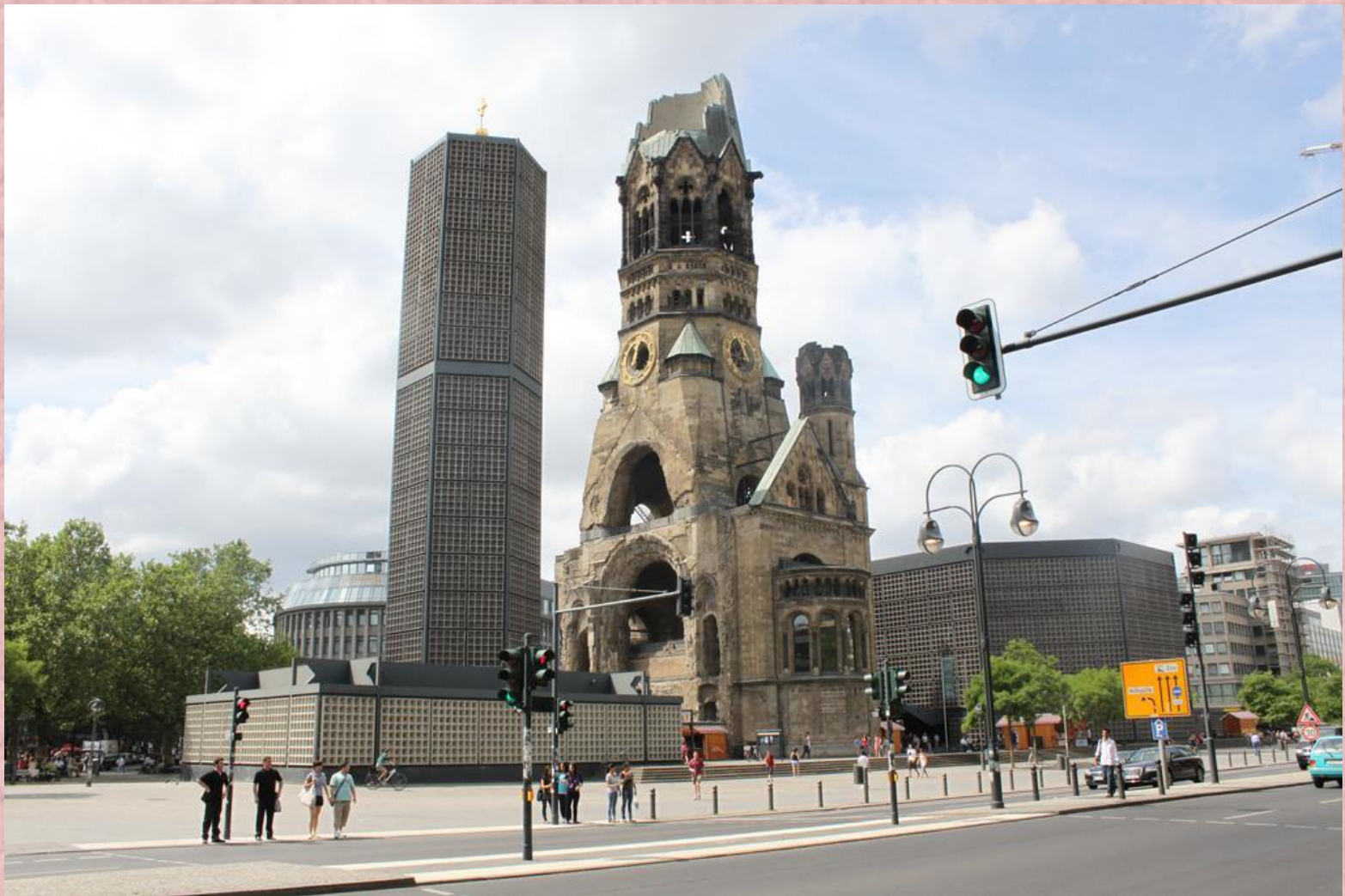
Kaiser-Wilhelm-Gedächtniskirche - die protestantische Kirche befindet sich am Breitscheidplatz.