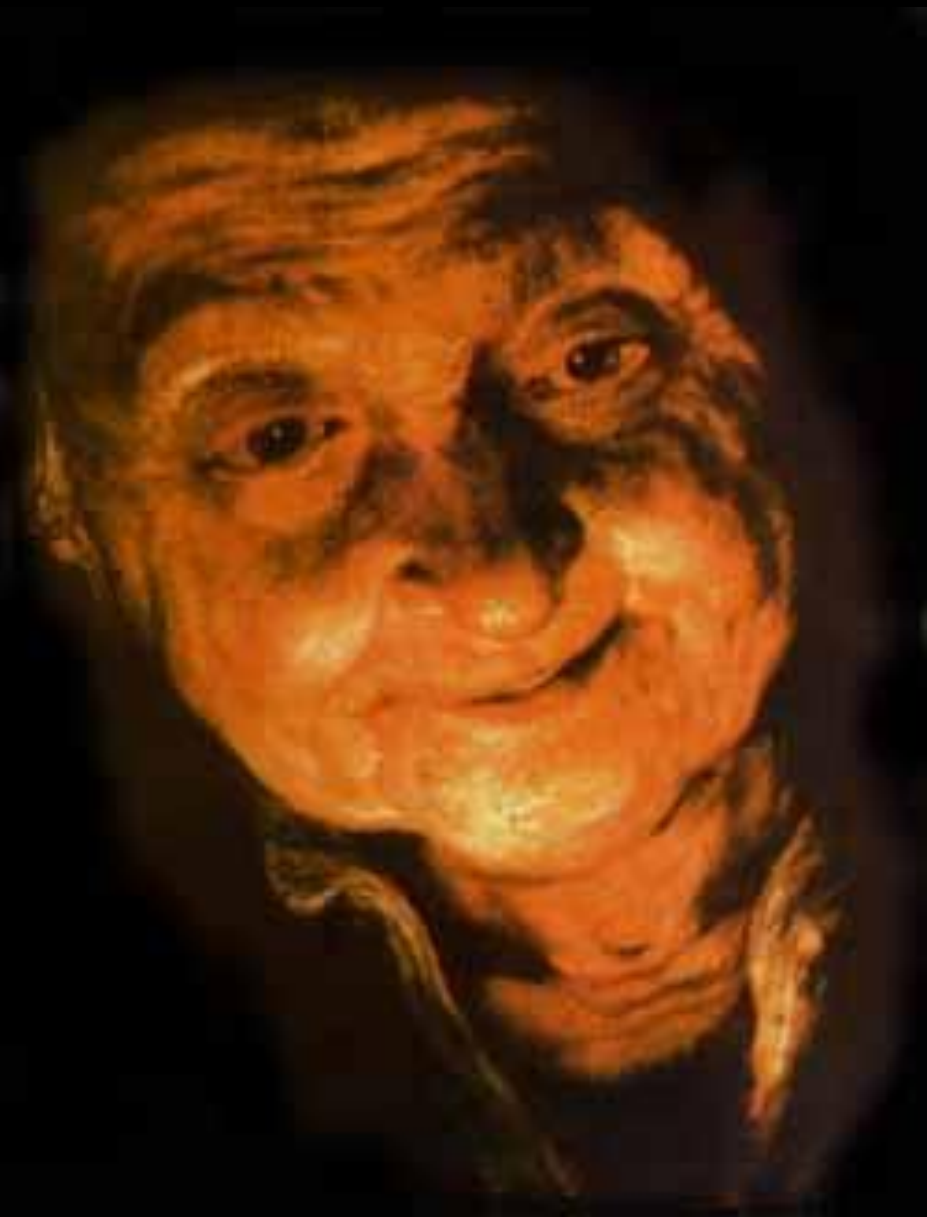
Рубенс – признанный мастер портрета.