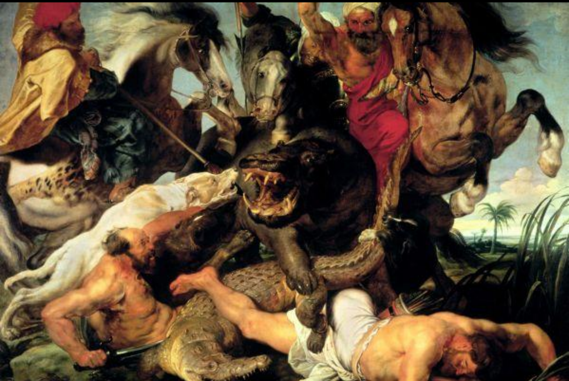
«Охота на гиппопотама»