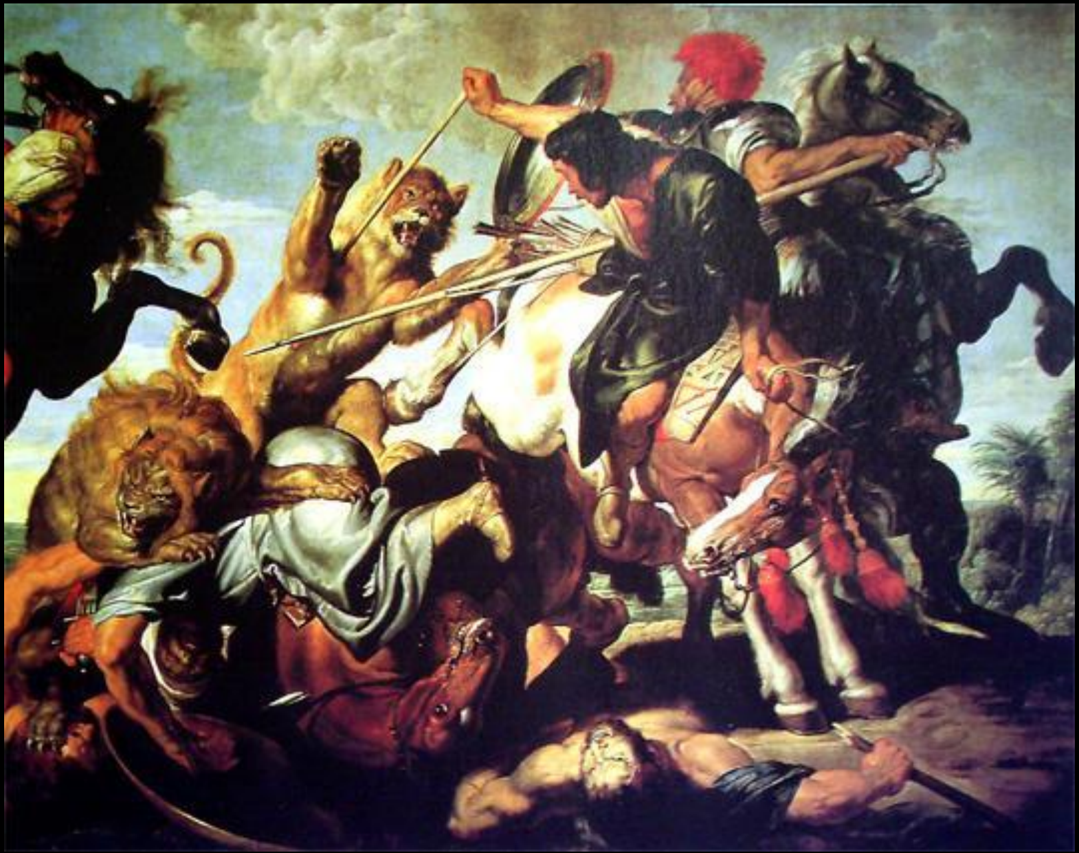
«Охота на львов»