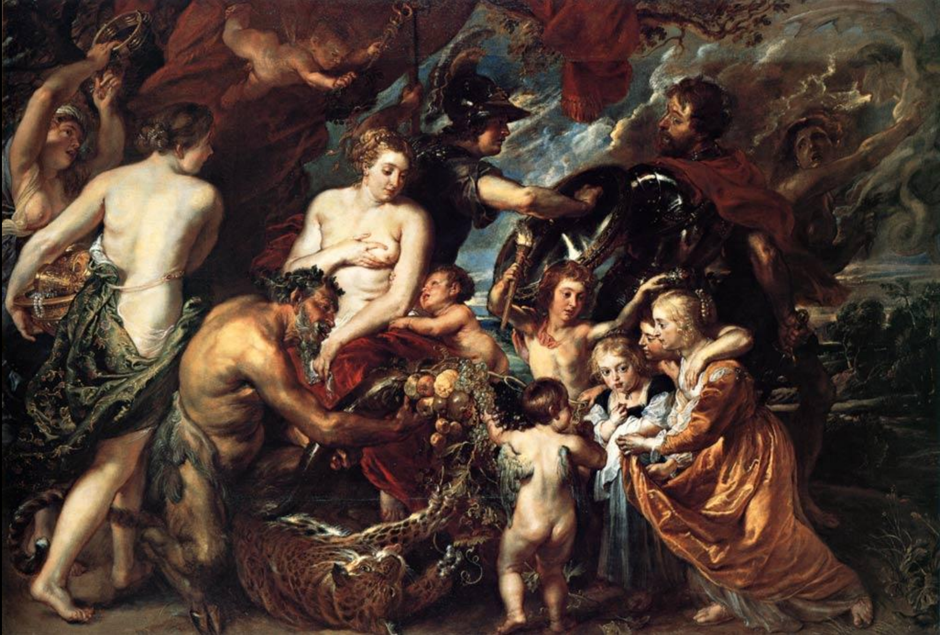
С помощью этой картины «Аллегория войны и мира» Рубенс смог «помирить» Англию и Испанию и способствовать установлению мира в войне этих стран.