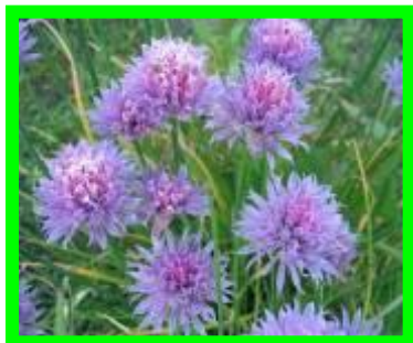
Лук - шнитт