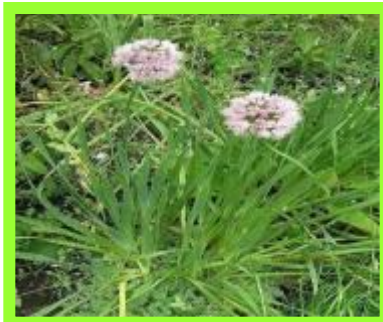
Лук - слизун