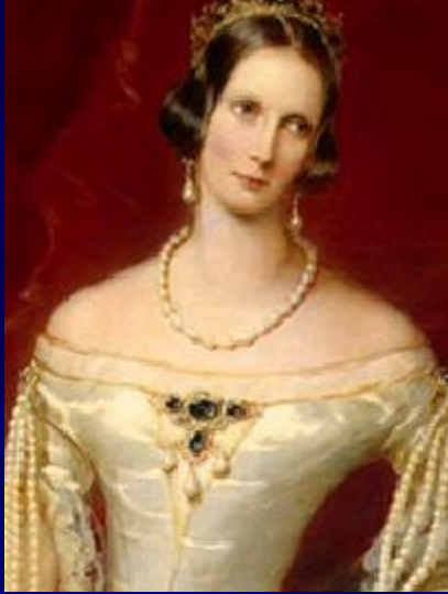
Императрица Александра Федоровна