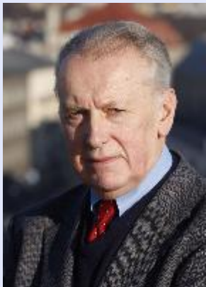
Петр Штомпка (Варшава, Польша, 1944 – н.в.)

Эммисон и Смит считают, что «визуальное – это исследование уже не только изображений, но и того, что видимо и наблюдаемо».