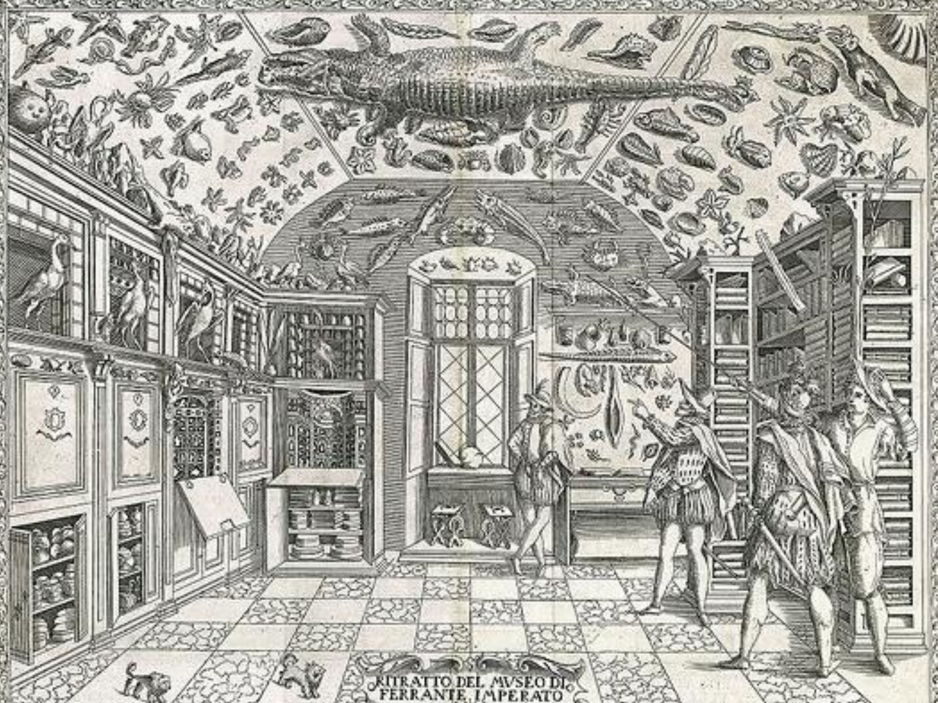
RITRATTO DEL MUSEO DI FERRANTE IMPERATO