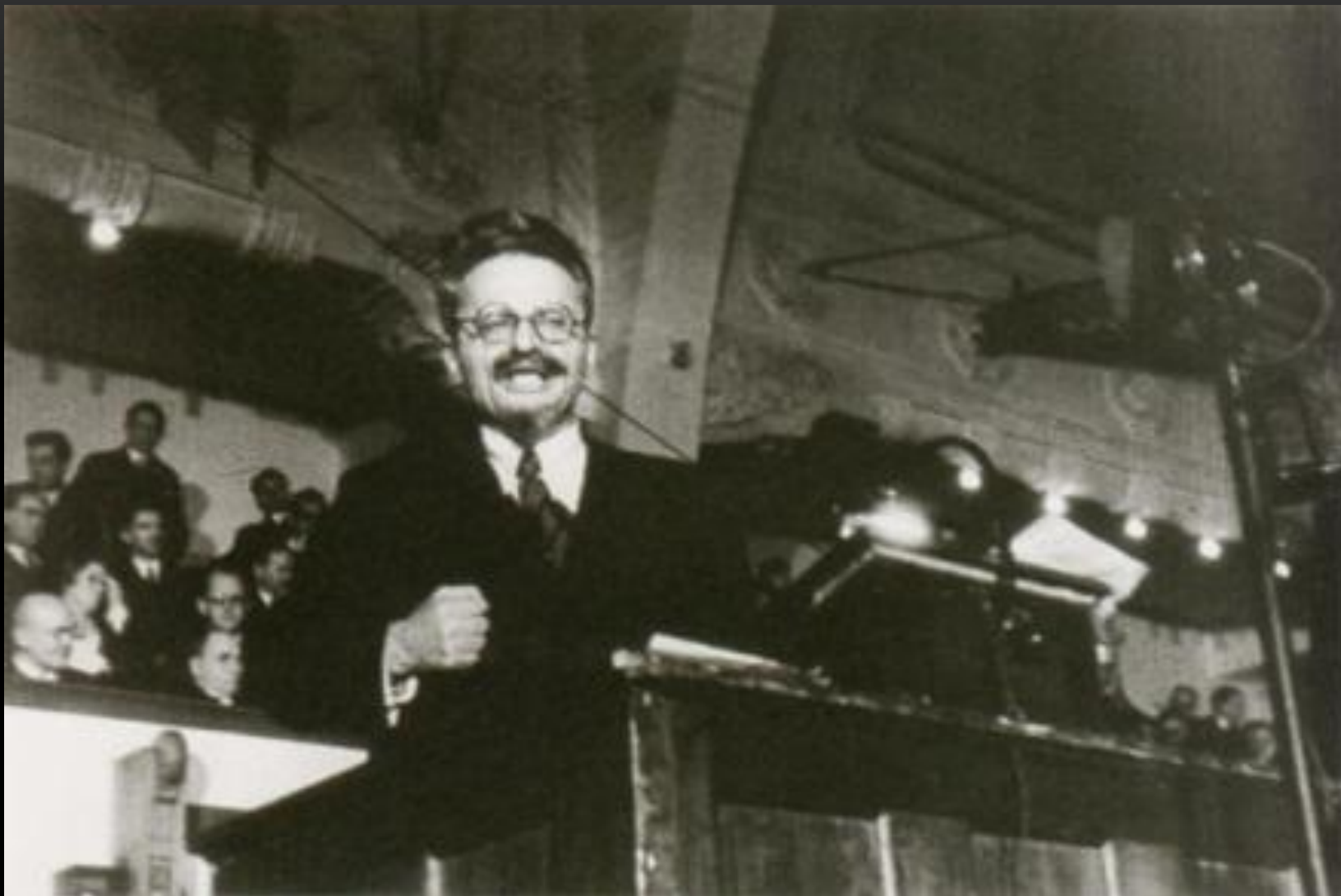
Лев Троцкий читает студентам Датского университета лекцию под названием «Значение Русской революции» Ноябрь 1932 г.