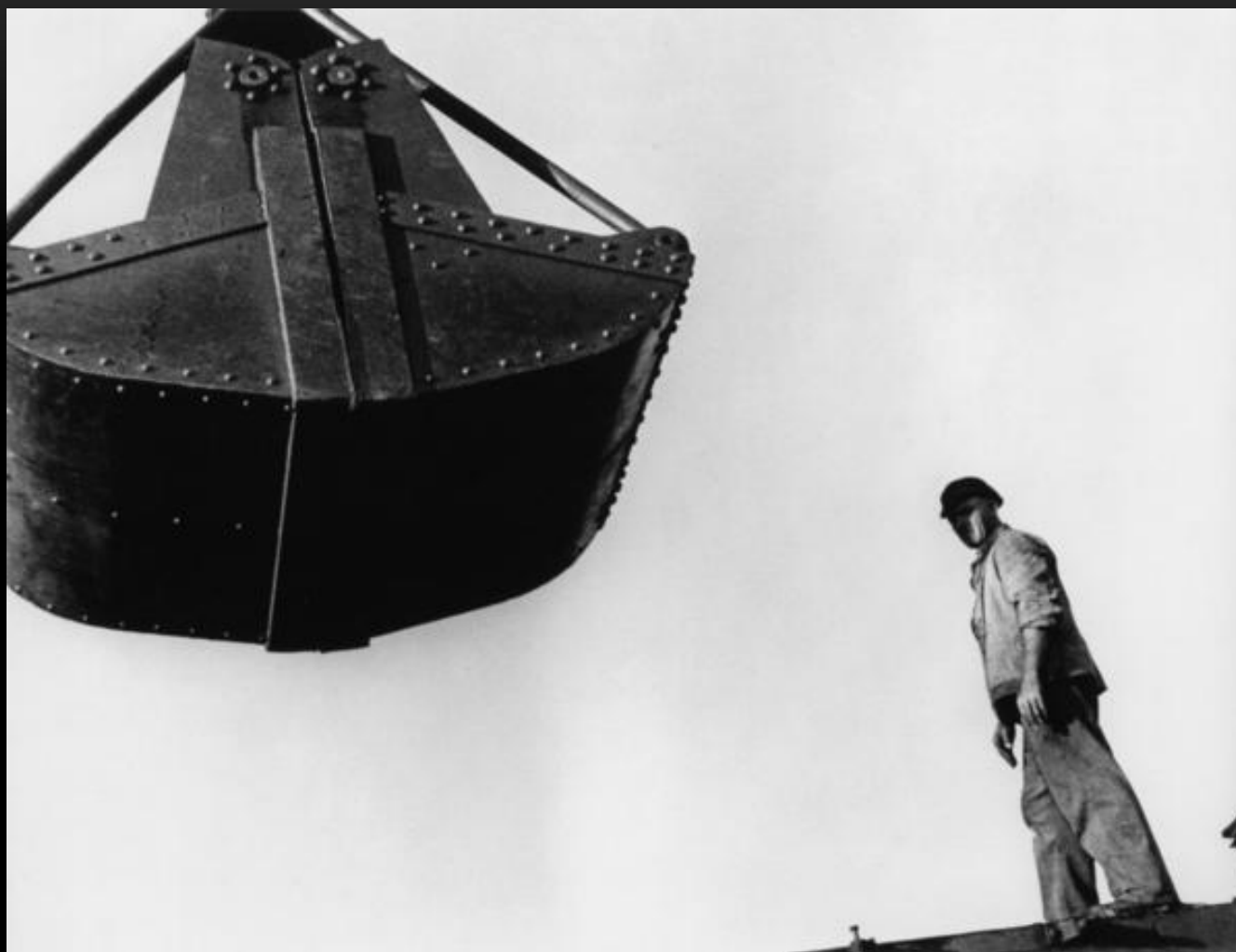
Саарланд (Saarland) Сентябрь 1934 г.