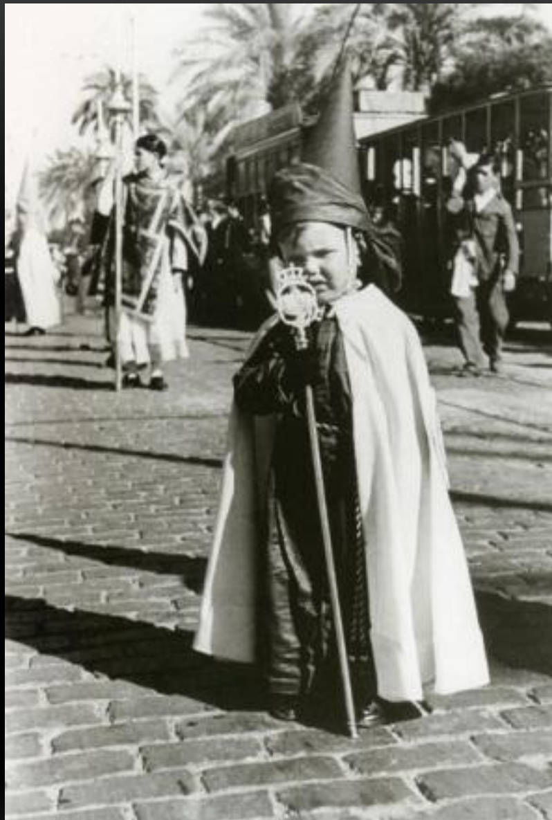
Юный участник религиозного шествия на Страстной неделе Севилья, Испания, апрель 1935 г