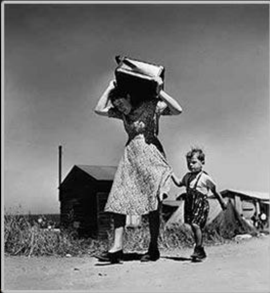
Прибытие эмигрантов в Хайфу (Израиль), 1949 год