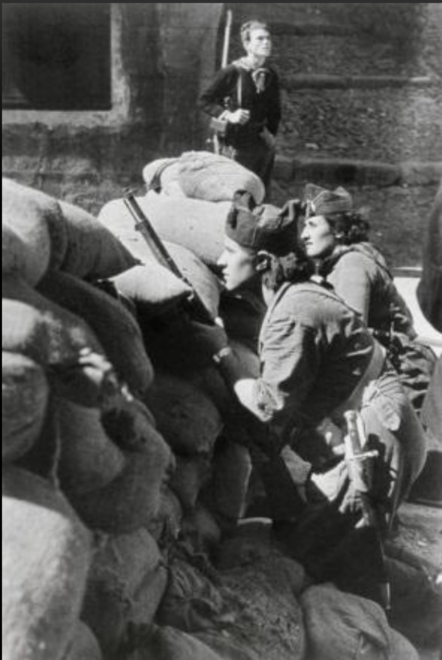
Солдаты-лоялисты на уличной баррикаде Барселона, август 1936 г.