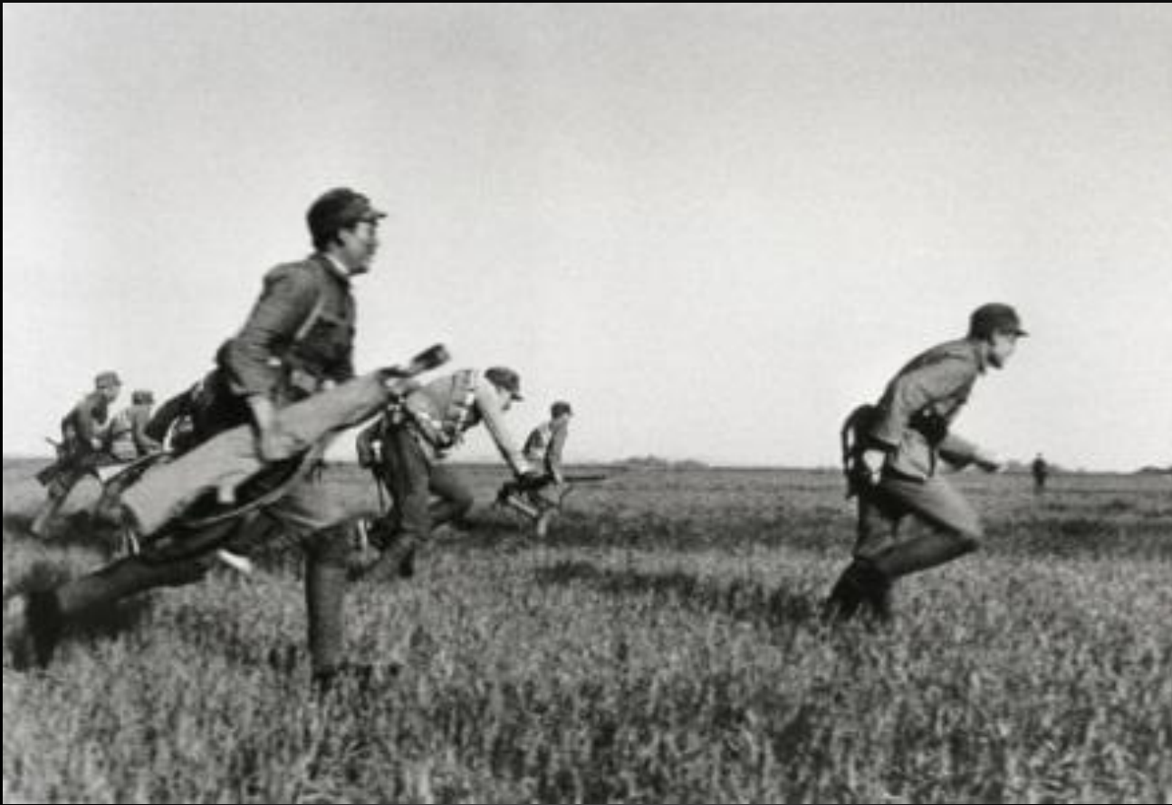
Китайские солдаты-националисты на учениях по борьбе с партизанскими отрядами Китай, 1938 г.

1938 год Капа работал в Китае, где вместе с Йорис Ивенс делал фильм о японском вторжении. Там же в Китае его английский заметно улучшился и это помогло ему в работе с американскими изданиями.