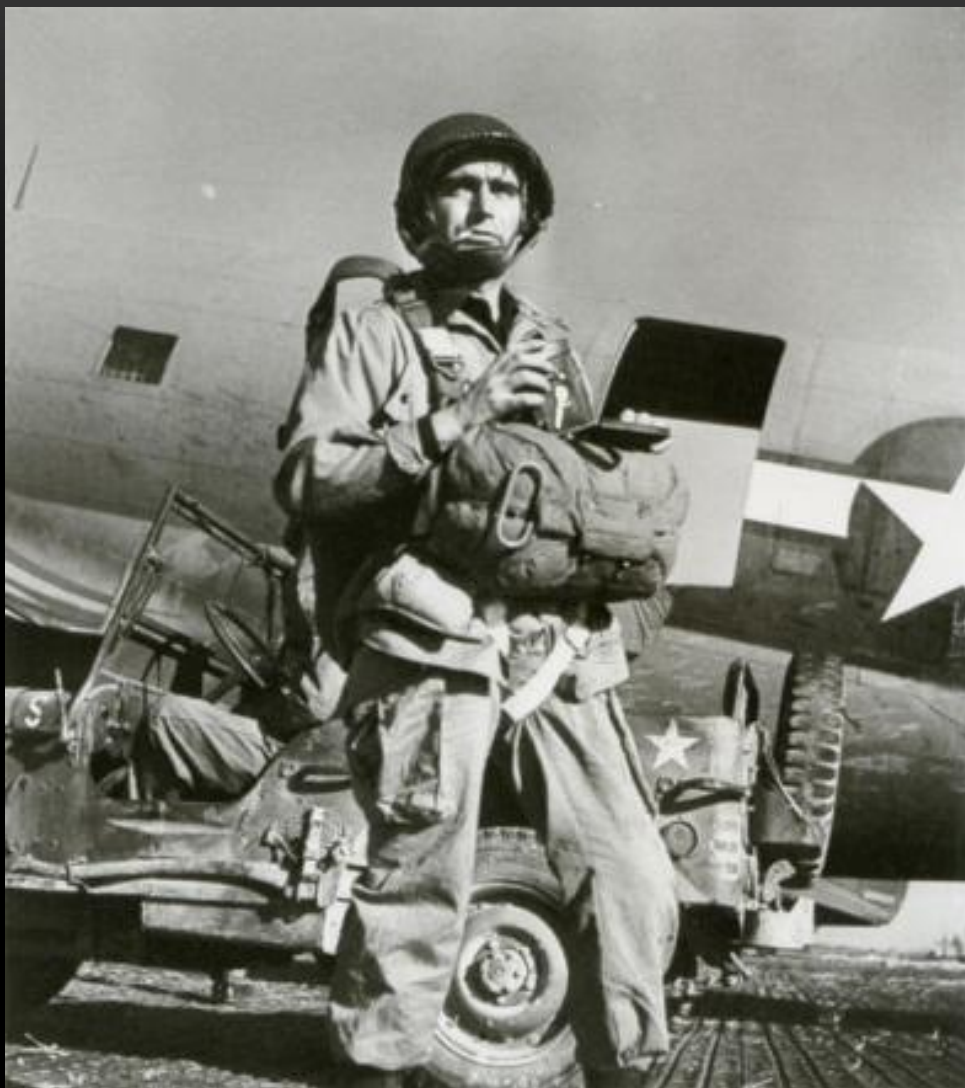
Капа в составе отряда парашютистов войск союзников готовится форсировать Рейн Март 1945 г.