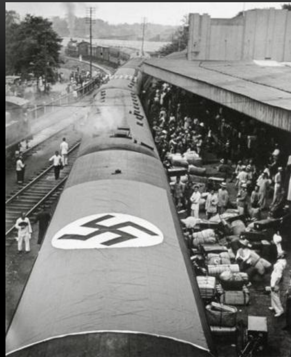
Ханькоу. Китай 5 июля 1938 г.