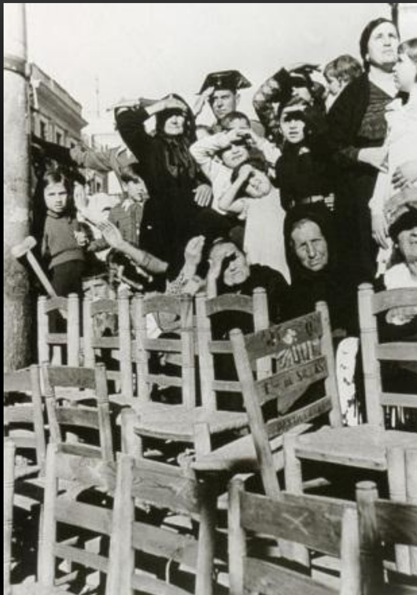
Зрители, наблюдающие за религиозным шествием на Страстной неделе Севиля, Испания, апрель 1935 г.