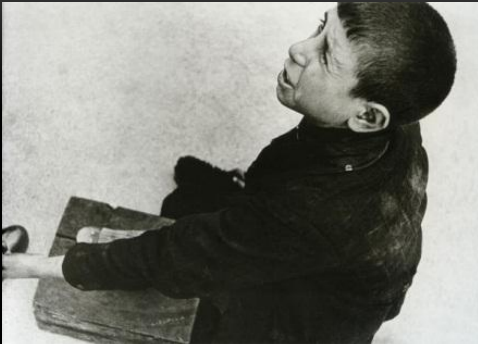
Мальчик-чистильщик обуви Сан-Себастьян, Испания, апрель 1935 г.