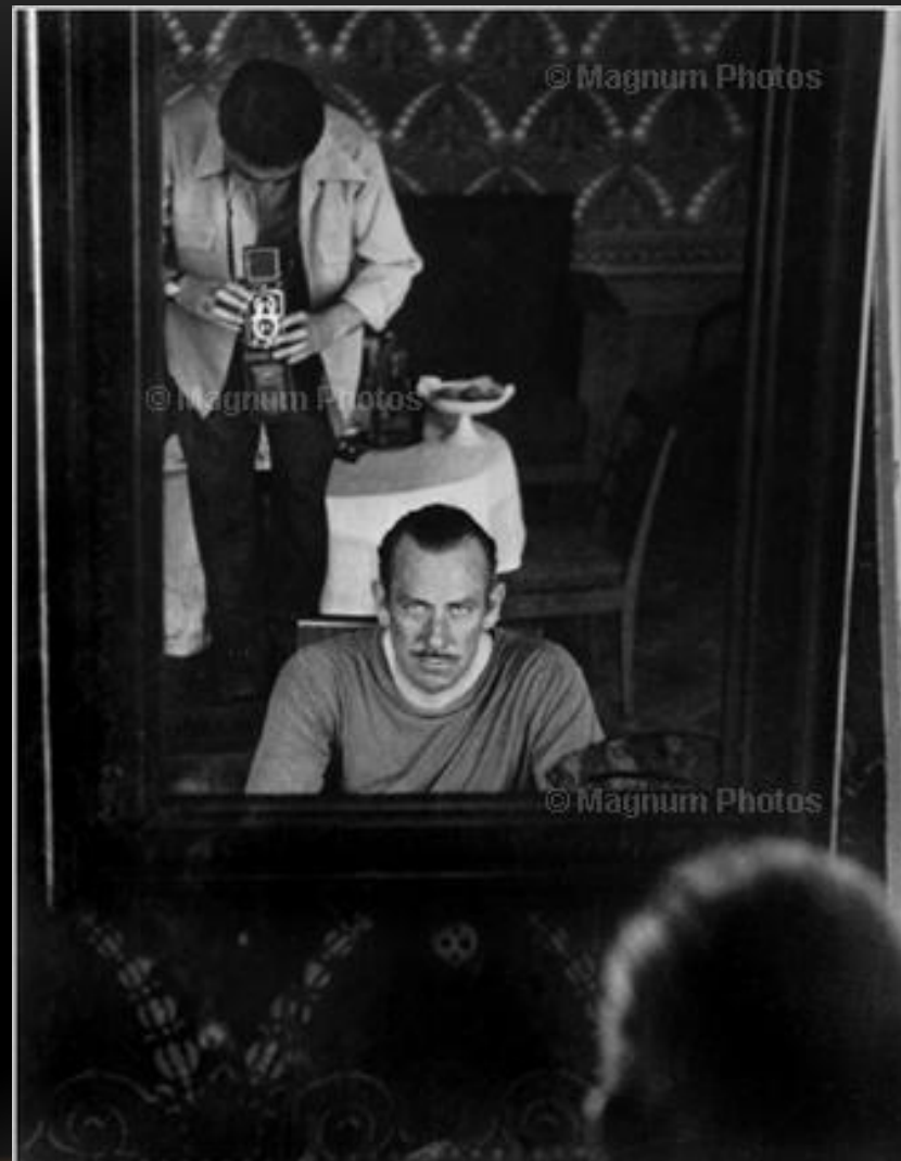
Роберт Капа фотографирует американского писателя Джона Стейнбека, Москва, сентябрь 1947