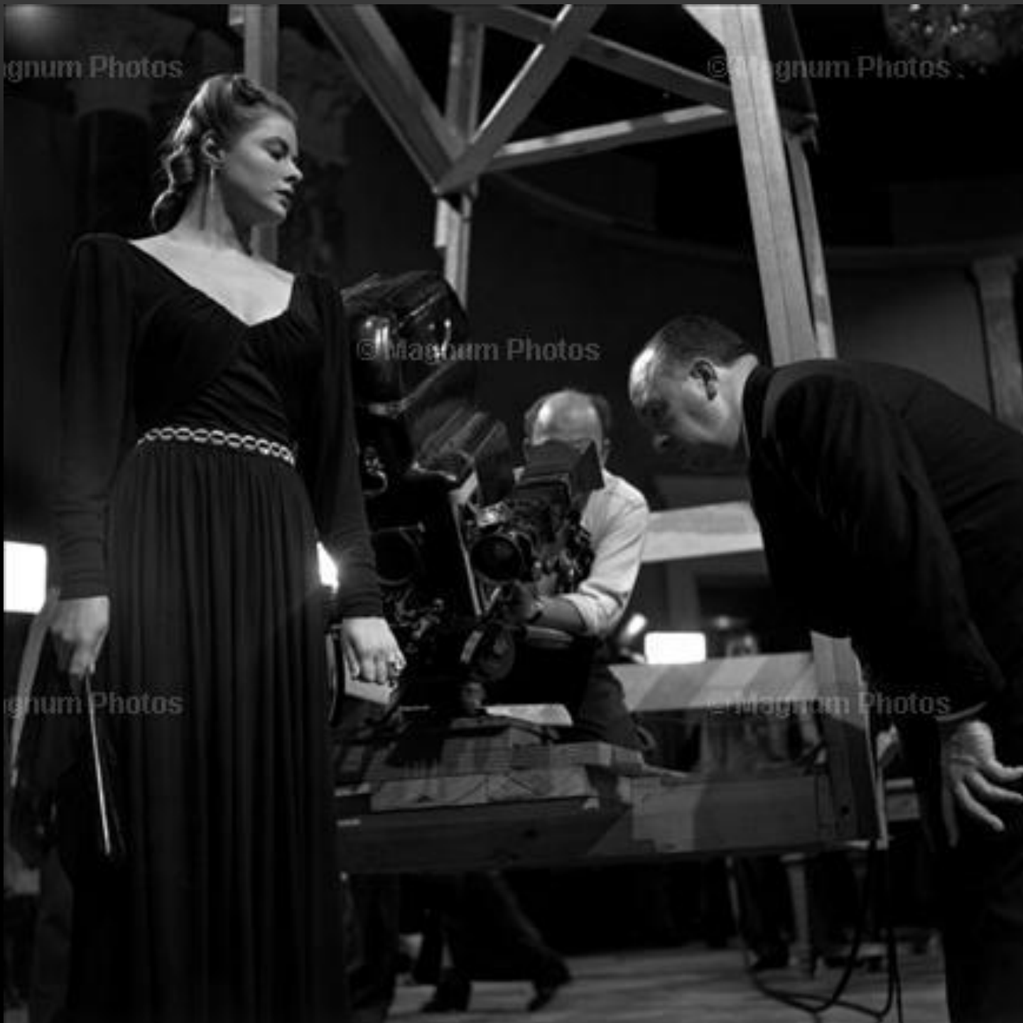
Ингрид Бергман и Альфред Хичкок, Голливуд, май 1946