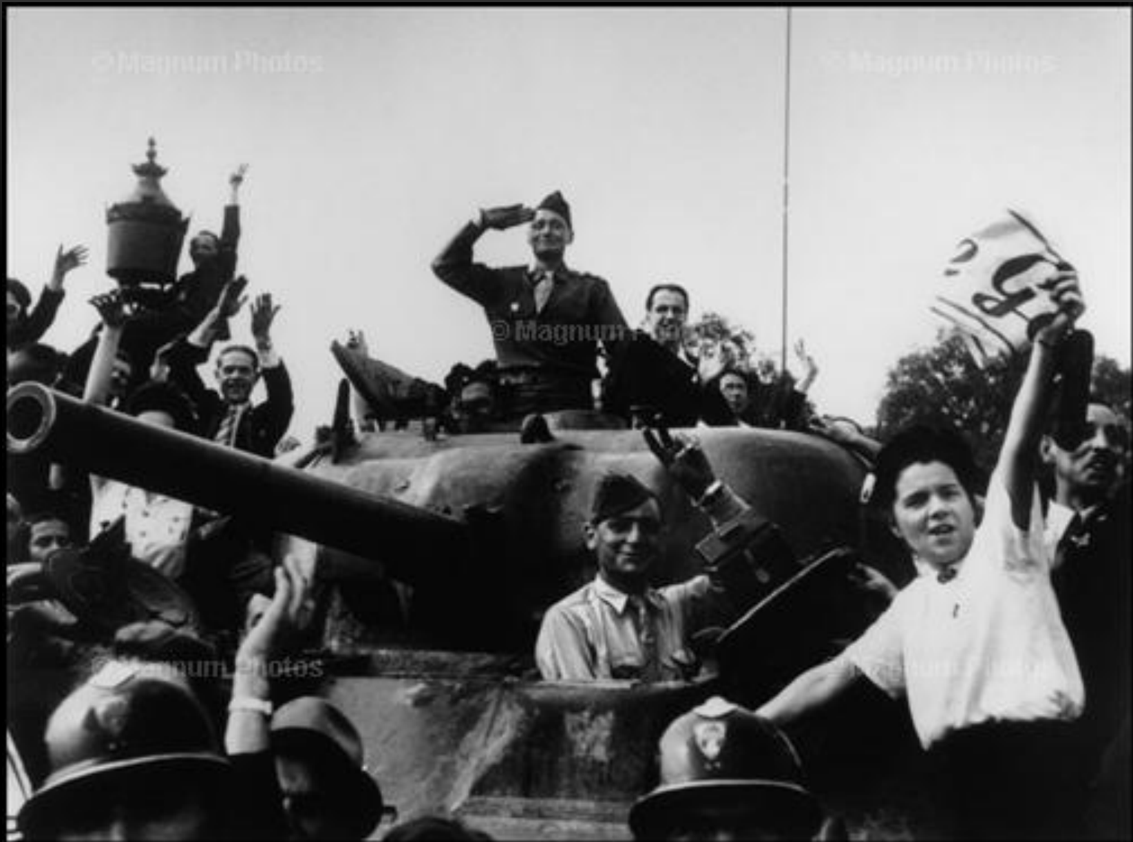
Празднование освобождения города, Париж Франция, 26 августа 1944