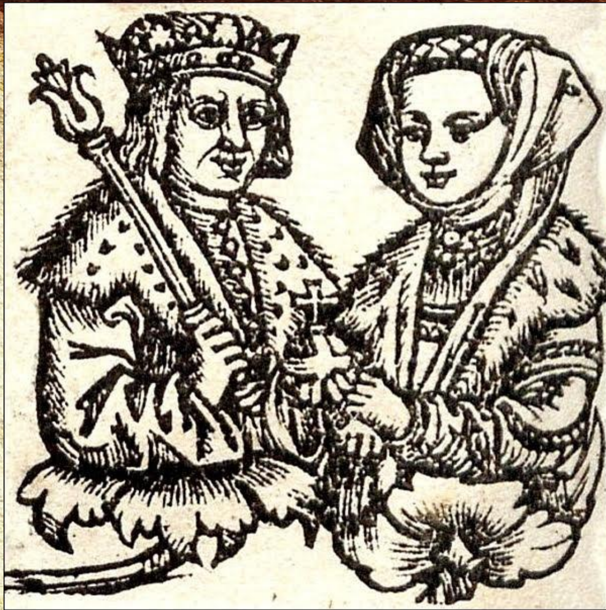
Великий князь литовский Александр с супругой Еленой, дочерью Ивана III