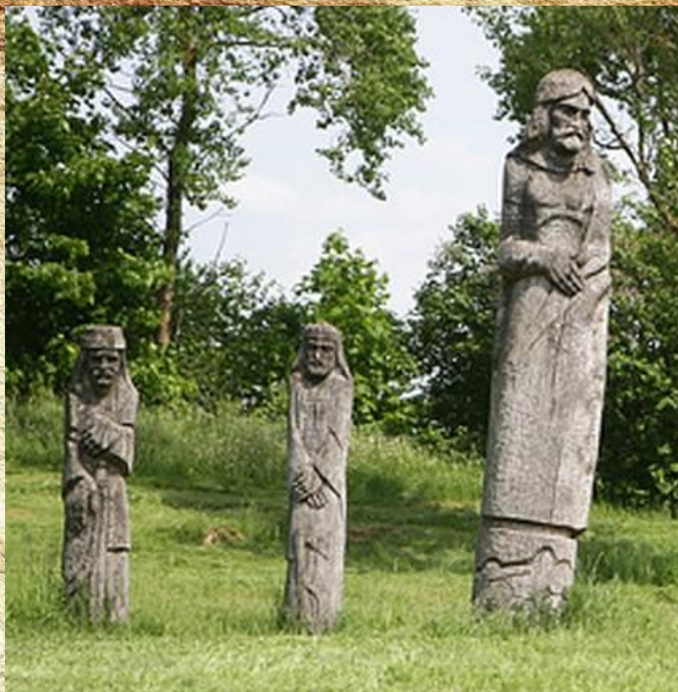
Снуд, Нов, Брас