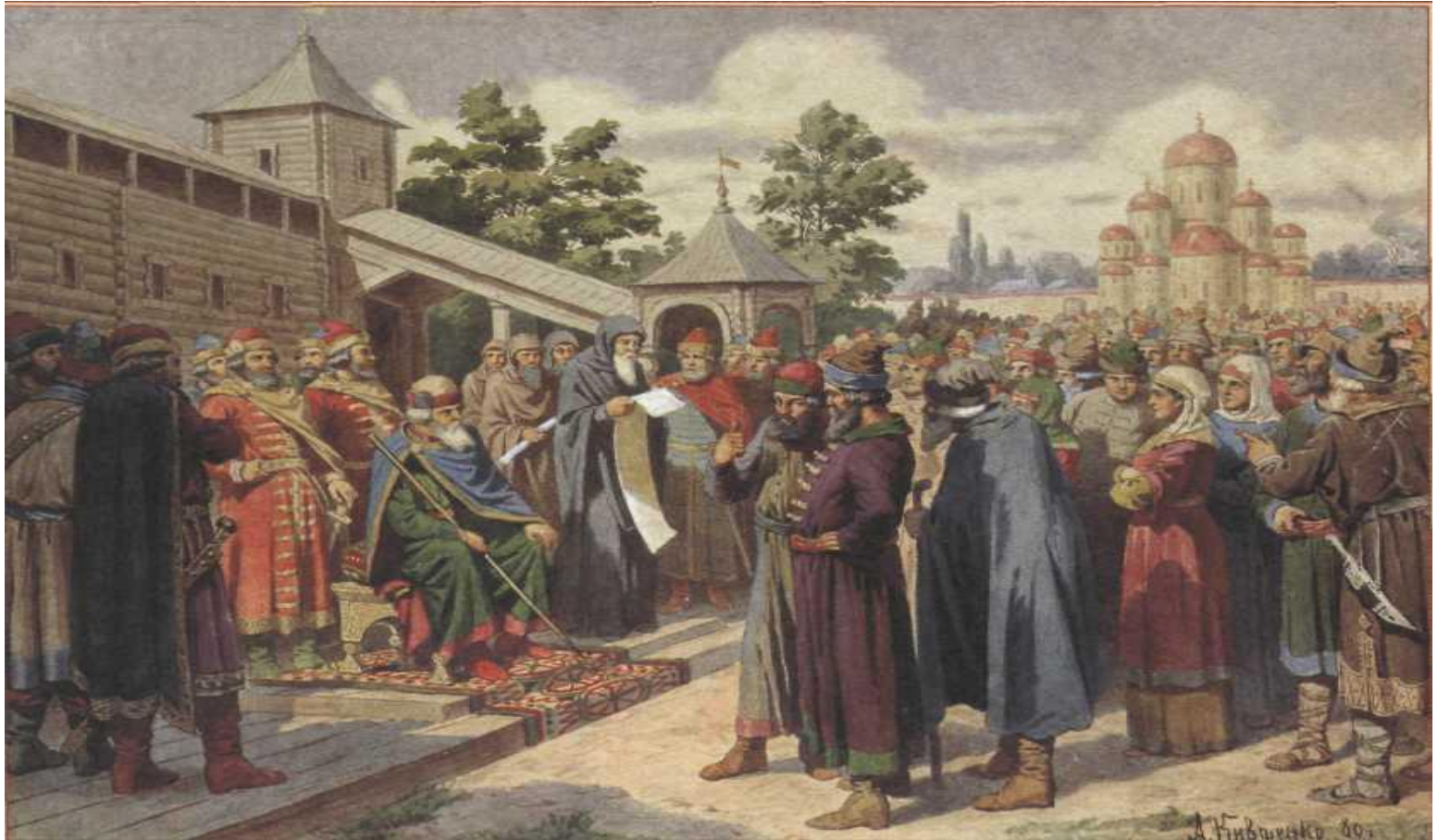
А. Кившенко. Чтение народу «Русской Правды» в присутствии великого князя Ярослава