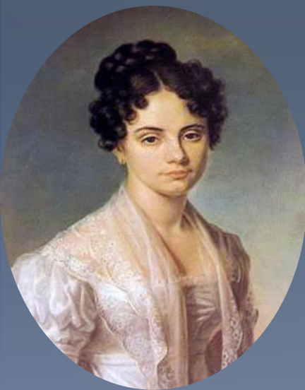
Мария Волконская (Раевская)